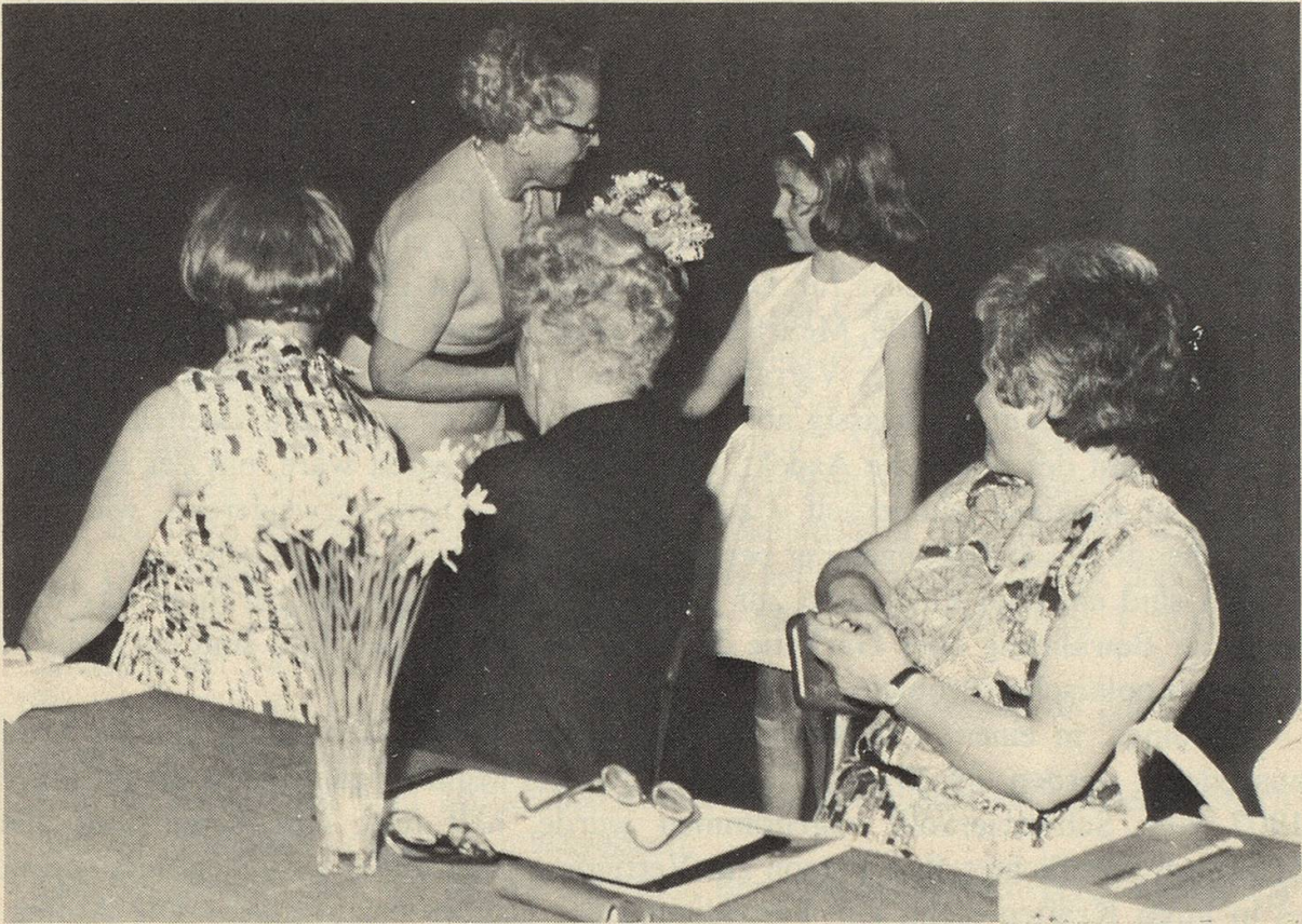
Eine kleine St.-Gallerin im hübschen Stickereikleidchen überreicht der Zentralpräsidentin Blumen

ner. Man hat deshalb mit Recht die Frage aufgeworfen, ob nicht eine allgemeinere Fassung der Verpflichtung zur Mitwirkung bei der Landesverteidigung insgesamt angezeigt wäre. Bei der Bearbeitung des Fragenkatalogs der Kommission Wahlen im Zusammenhang mit der Totalrevision der Bundesverfassung wurde verschiedentlich diese Anregung gemacht. Man hört aber auch im Zusammenhang mit der Dienstverweigererfrage von einer Statuierung einer allgemeinen Dienstpflicht, die, meint man, neben dem Zivilschutz auch einen Zivildienst für Dienstverweigerer mit umfassen würde.