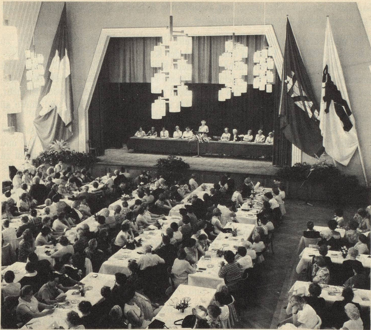
Blick von der Galerie in den Saal und auf die Bühne

Die Einsicht, dass Frauen ebenfalls Militärdienst leisten könnten , setzte sich erst im Ersten und Zweiten Weltkrieg durch. Im Artikel 4, Absatz 3, des Dienstreglements 1967 ist die Mitarbeit der Frau in der Landesverteidigung folgendermassen umschrieben: «Die Schweizer Bürgerin, die sich zum Dienst in der Armee meldet und als Freiwillige in den Hilfsdienst aufgenommen wird, hat die gleichen militärischen Pflichten und Rechte wie der Wehrmann. Sie ist als Gleichberechtigte zu achten; Ritterlichkeit ihr gegenüber ist Ehrensache.»