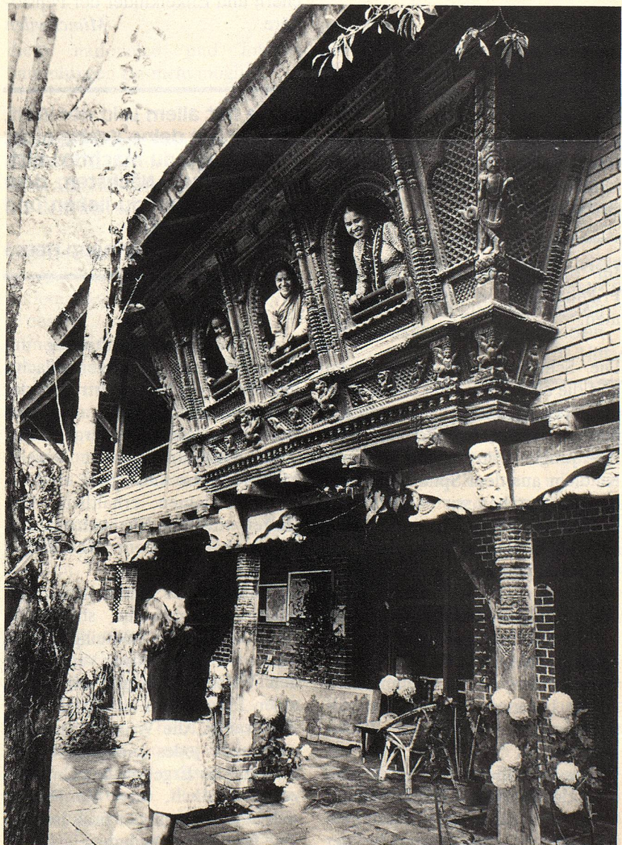
Annemarie Spahr mit drei Hotelangestellten im Dwarika-Hotel