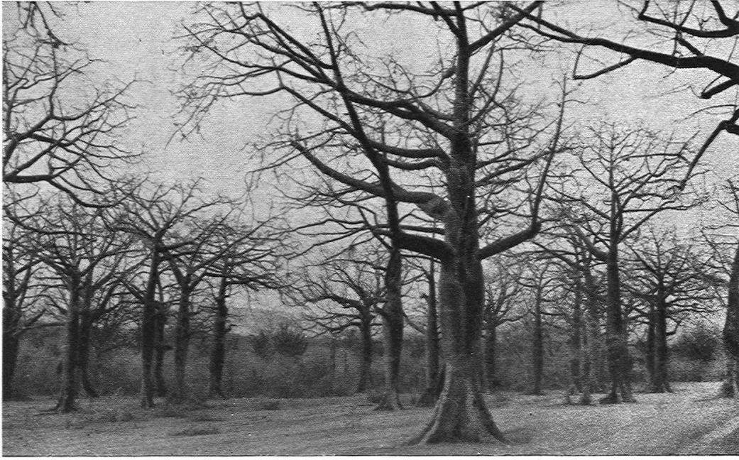
Ceiba-Bestand bei Manta (Trockener Küstenstreifen von Manabi).