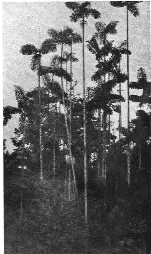
«Chonta»-Palmen (Iriartea). Gürtel des Tropischen Regenwaldes am Westfuss der Anden.