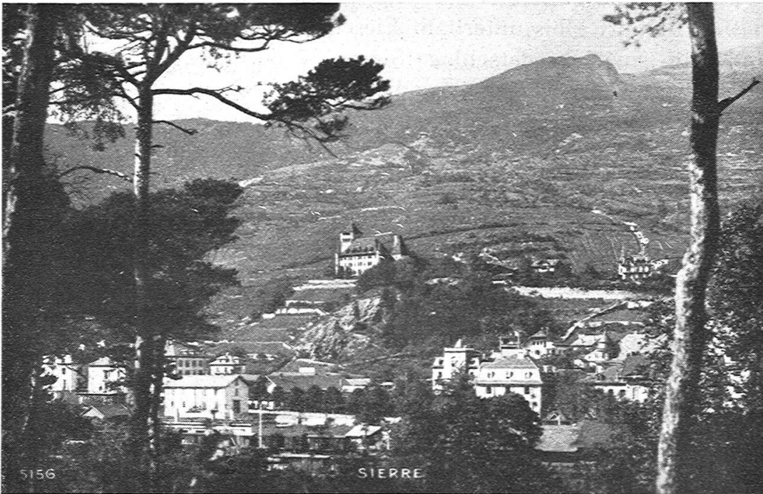
Fig. 1. Siders mit dem nördlichen Berghang. (Aus dem Album de Sierre Edit. Art. Perroche-Matile, Lausanne).

Verbandes, der Schweizerische Geographielehrerverein, hat den geringsten persönlichen Kontakt, da seine 370 Mitglieder über das ganze Land zerstreut sind. Der von ihm in Verbindung mit der Firma Kümmerly & Frey, die dafür Opfer bringt, gegründete «Schweizer Geograph» bildet das Band, das alle Mitglieder umschlingt. Ihn auszubauen und ihm neue Freunde zu werben, wird unsere stete Sorge sein. Die Geographische Gesellschaft Bern und die Geographisch-Ethnographische Gesellschaft Zürich referieren regelmässig in unserer Zeitschrift über ihre Vorträge und Exkur-