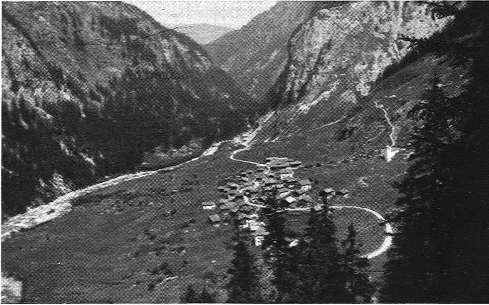
Fig. 1. Dorfbild von Süden aufgenommen.

1 ehemalige Schmiede sind schon längst verlassene Wohn- und Arbeitsstätten. Im Jahre 1705 1) stürzte ein grosses Stück des Sutt Foinagletschers am Nordhang des Piz Grisch oder Fianells zu Tal und staute den Mühlebach. Dann durchbrach das Wasser das Hindernis, stürzte gegen das Dörfchen hinunter und verheerte, gewaltige Steine mit sich führend, die Matten westlich desselben. Den Fluten fiel eine Säge am Mühlebach zum Opfer. Im Jahre 1832 überschwemmte auch der Ferrerabach, dessen Bachbett vorher viel höher gelegen war, den nördlichen Teil des Dörfchens, ein Wohnhaus und zwei Ställe mit sich reissend.