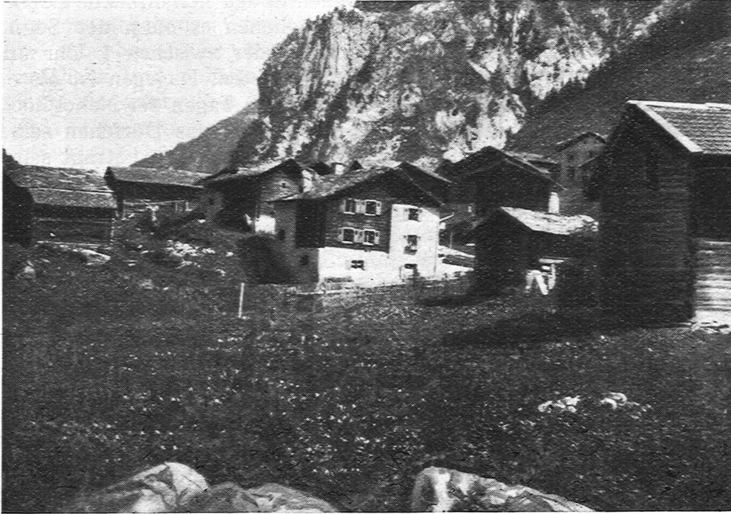
Fig. 4. Mitte des Bildes Pension Grischott-Etter.

in die Stube, anderseits in die Küche, von wo — wenn nicht vom Gang aus — eine steinerne oder hölzerne Treppe in den Keller hinunter führt, der meistens nur unter der Stube liegt. Die Küche befindet sich direkt auf ebener Erde. Der Küchenboden besteht in vielen Häusern aus Holz. Der Rauch und Dampf in der Küche 1) findet durch den offenen Rauchfang den Weg in das Kamin, das bei manchen Häusern mit einer Steinplatte beschwert ist. In der Stube steht der oft aus Granit bestehende, längs der Kanten mit Holzleisten ver-