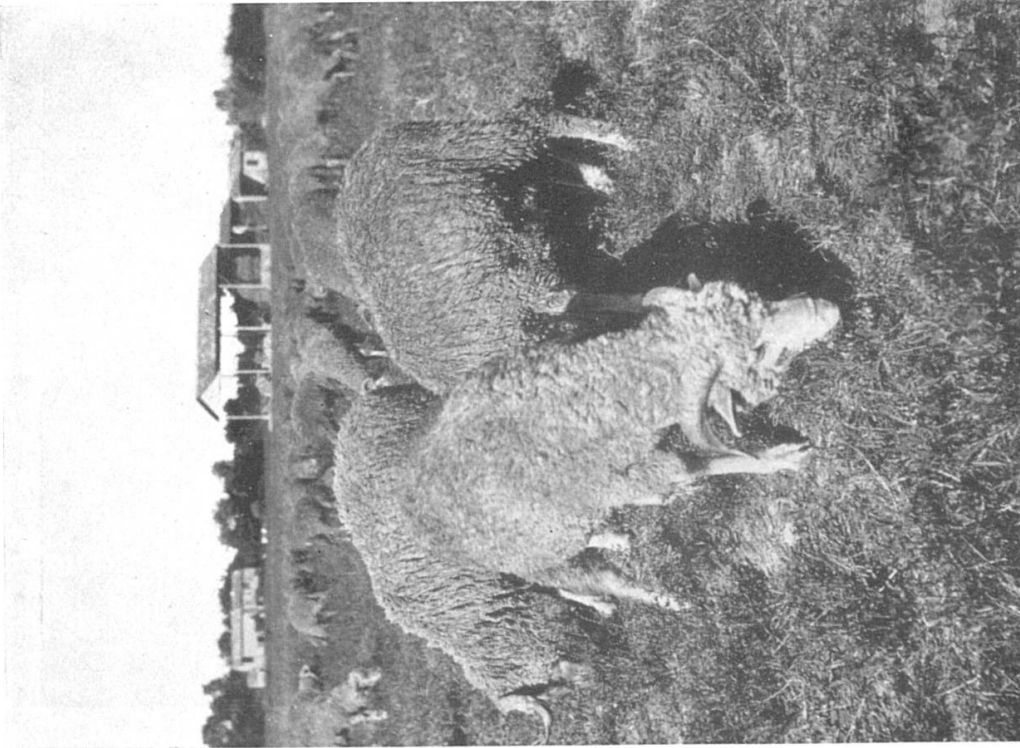
Abbild. 7. Merino-Kreuzung.