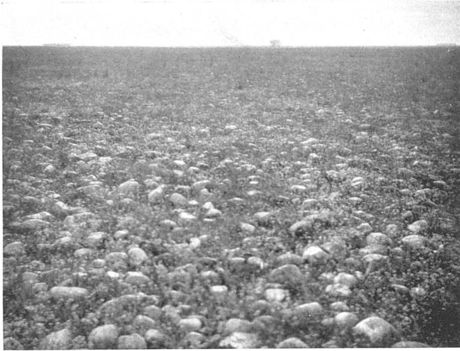
Abbild. 5. Wilde Crau; «Coussons» s. Schloss Vergières (St-Martin de Crau).