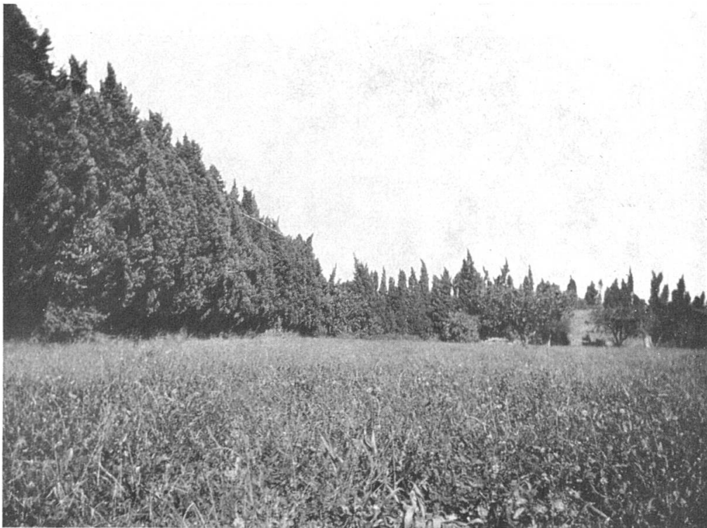
Abbild. 6. Wässerwiese mit Zypressenhecke (St-Martin de Crau).