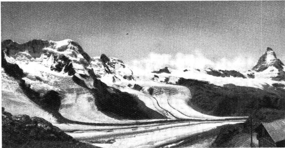
1. Blick vom Gornergrat auf Breithorn und Matterhorn; im Vordergrund der Gornergletscher.

kennen sind; ferner die vom Riffelberg, sowie auch die westlich des Unter-Rothhorn. Es ist denkbar, dass diese Hochfläche ein präglaziales Abtragungsniveau darstellt. Wir können dabei für das präglaziale Tal über Zermatt eine Höhe von 2400 m annehmen. Aber die ehemals fluviatil entstandene Erosionslandschaft dürfte hier im Laufe des Eiszeitalters bis zur Gegenwart eine bedeutsame Umgestaltung durch die Gletscher erfahren haben. Alle in der Eiszeit überflossenen Gebirgstteile sind heute abgerundet, buckelig, was darüber emporreicht, zeigt gratförmigen Charakter und weist weitgehende mechanische Verwitterung des Gesteins auf. So erscheint sehr deutlich auch die heute apere untere Partie des Theodulplateaus glazial umgeformt.