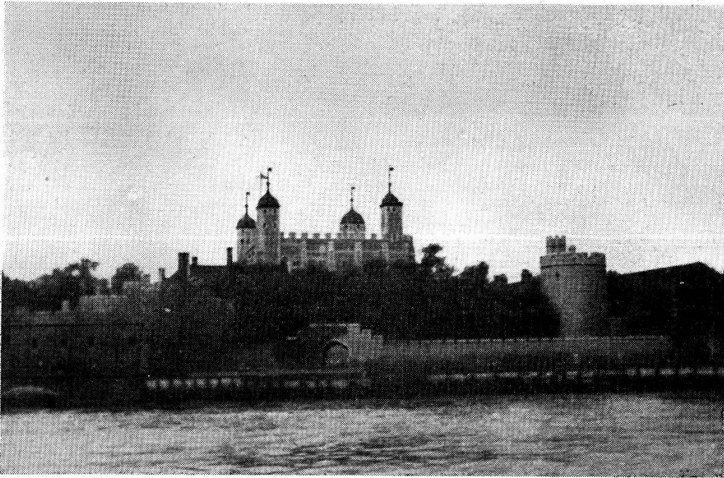
Abb. 1. The Tower of London.