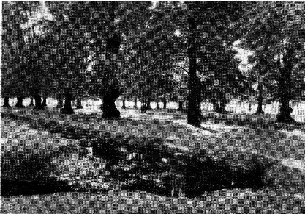
Abb. 5. Bushey-Park bei London.