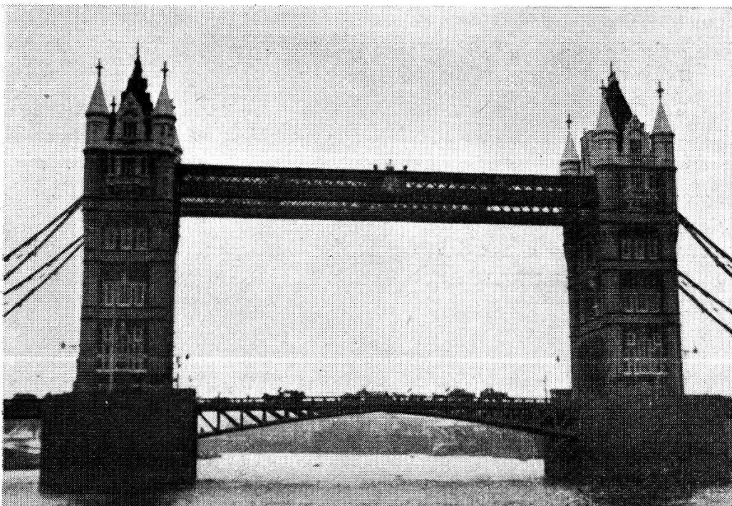
Abb. 6. Die aufziehbare Waterloo-Brücke nahe der City.