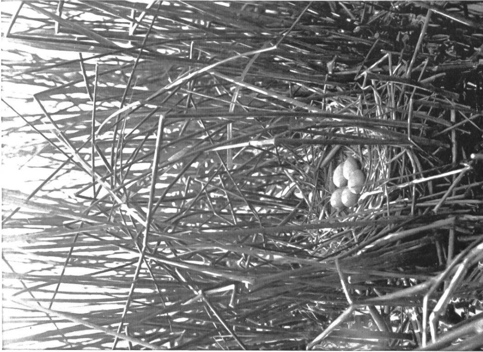
Wasserhuhnneest mit schöner Überwölbung.