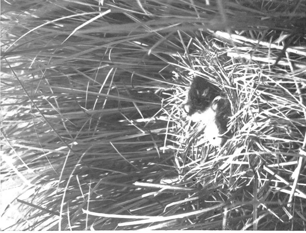
Junge Wasserhühnchen und angebrochenes Ei.