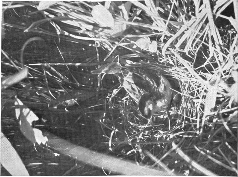
Zwergsumpfhühnchen, zum Brüten niedersitzend. Aufbrechendes Ei im Neste!

Nest im Riedgrasstock, Kaltbrunnerried. 14. Juni 1916.