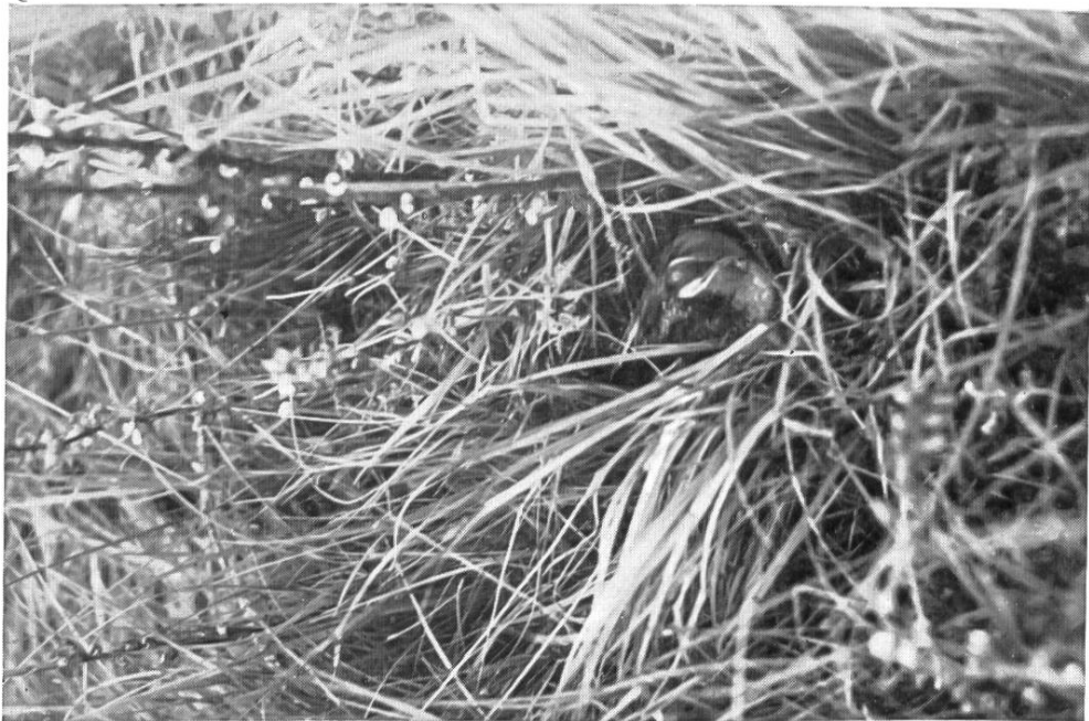
Zwergsumpfhuhnweibchen brütend. Nest im Läusekraut! Man beachte die spärliche Fleckung des Rückens und das Weiß der Wangen. Kaltbrunnerried. 7. Juli 1916.