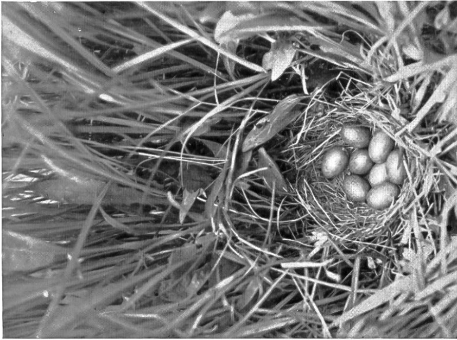
Nest des Zwergsumpfhühnchens im Riedgrasstock