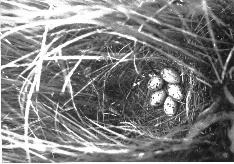
Nest des getüpfelten Sumpfhühnchens (zirka \frac{1}{4} natürlicher Größe). Kaltbrunnerried. 13. Juli 1916.