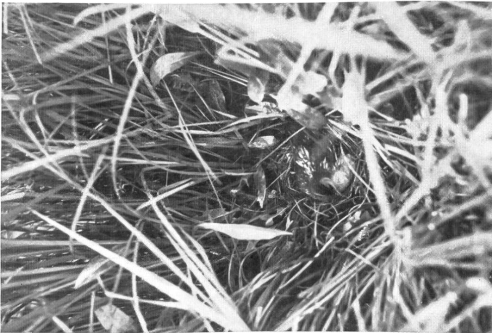
Zwergsumpfhühnchen, brütend im Riedgrasstock. Weibchen mit starker Rückenfleckung, Wangen blauweiß. Kaltbrunnerried. 14. Juni 1916.