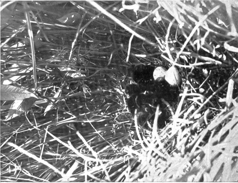
Nest voll junger Wasserrallen (zirka \frac{1}{4} natürlicher Größe). Kaltbrunnerried. 3. Juli 1916.