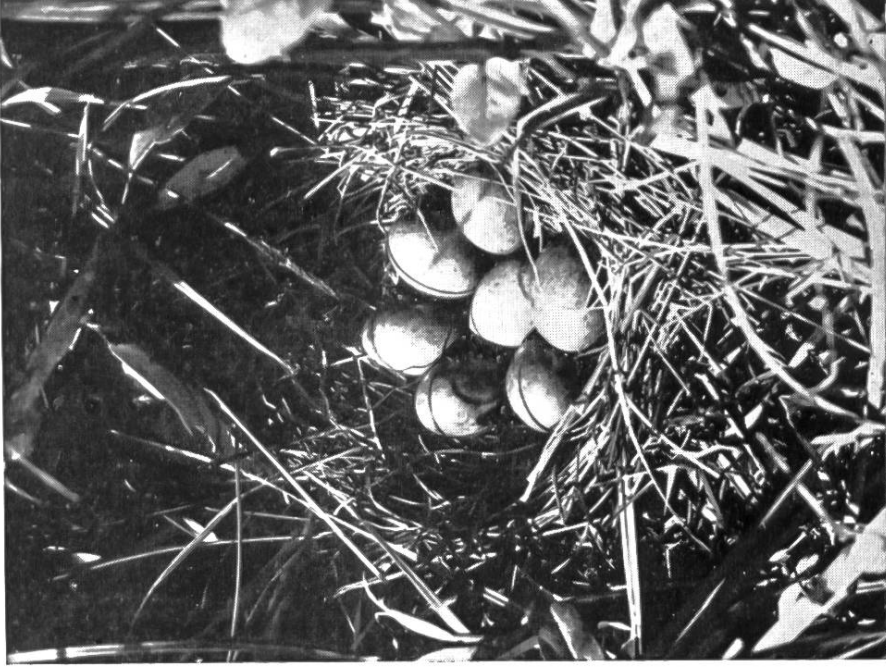
Nest des Zwergsumpfhühnchens im Riedgrasstock