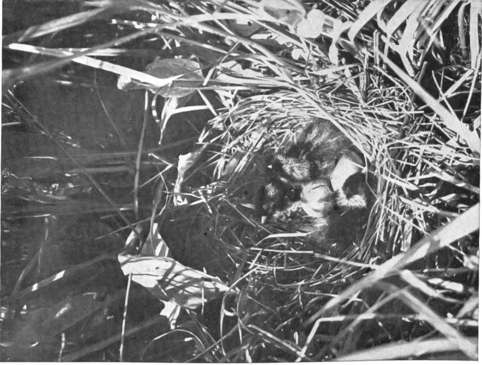
Junge Zwergsumpfhühnchen, einige Stunden alt.

Nest im Riedgrasstock, Kaltbrunnerried. 14. Juni 1916.