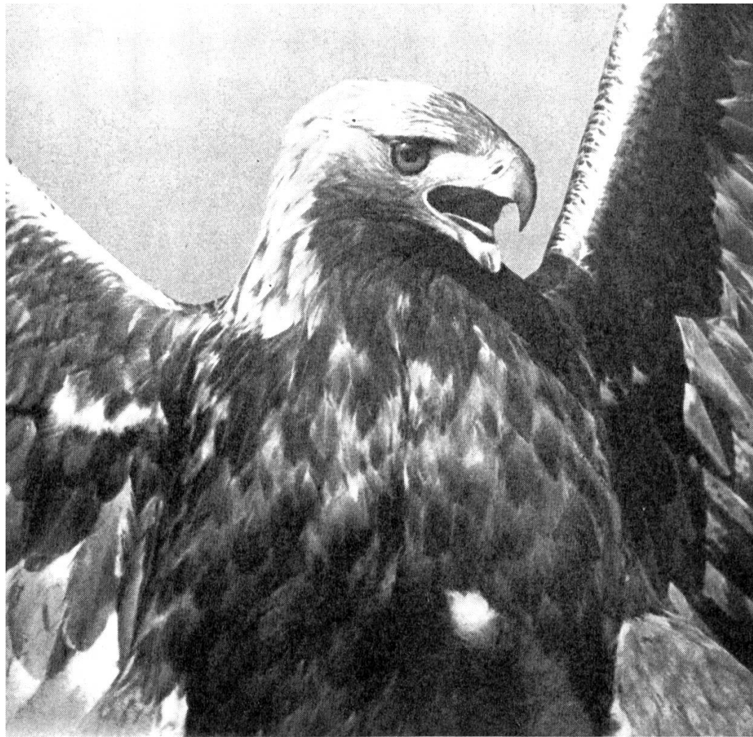
Abb. 3 Steinadler, präpariert von E. Zollikofer, Museum Bonn