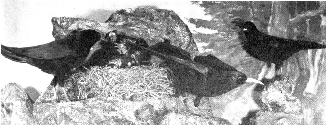
Abb. 2 Alpenkrähen und Alpendohle, Gruppe im Ostsaal des St.Galler Museums