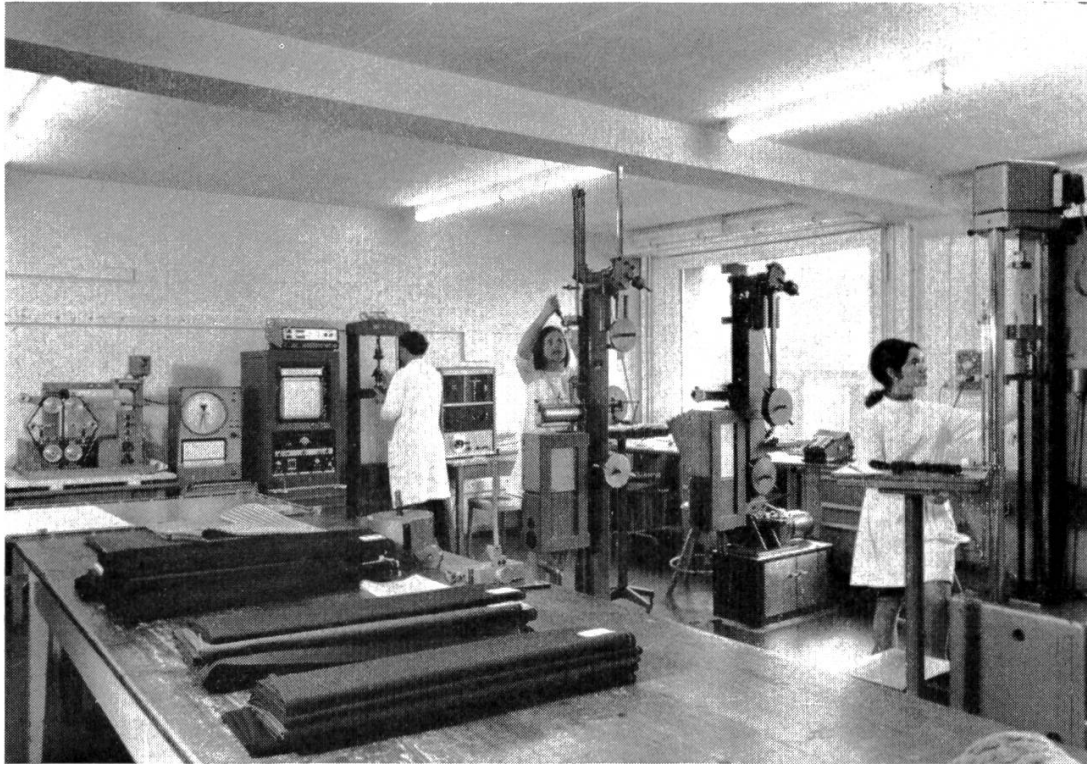
Klimatisierter Prüfraum für physikalische Garn- und Gewebeuntersuchungen.