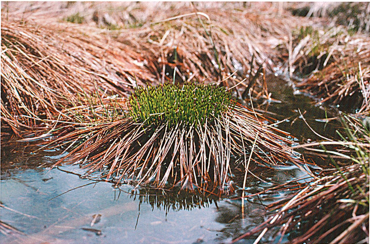
Abbildung 5: Cholwald/Schwägalp, Bülte und Schlenke.