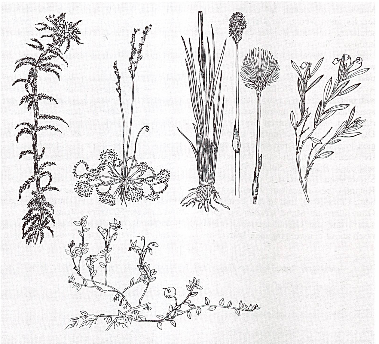
Abbildung 6: Charakteristische Hochmoor-Pflanzen. Oben: Torfmoos ( Shagnum spec. ) vergrößert; Rundblättriger Sonnentau ( Drosera rotundifolia ); Scheidiges Wollgras ( Eriophorum vaginatum ), Stengellänge 20–50 cm. Unten: Rosmarinheide ( Andromeda polifolia ) verkleinert; Moosbeere ( Vaccinium oxycoccos ), Zweige oft bis 1 m lang. (Aus GÖTLICH, 1990, verändert).

Auf und neben den Torfmoosen wachsen die wenigen aufgezählten Blütenpflanzen (Abbildung 6). Der Rundblättrige Sonnentau ist befähigt, mit den Moosen in die