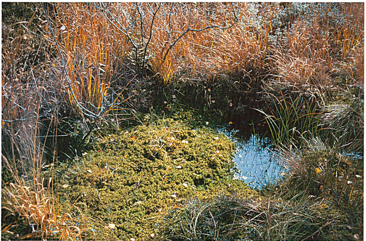
Abbildung 3: Gontenmoos AI, Schlenke mit Torfmoos..

Umgangssprachlich finden wir neben Hochmoor, Flachmoor (auch Niedermoor genannt) und Zwischenmoor noch andere Moortypen: Quell- oder Hangmoor, Wiesenmoor, Waldmoor, Schilfmoor, Seggenmoor und andere. Sie beziehen sich auf die