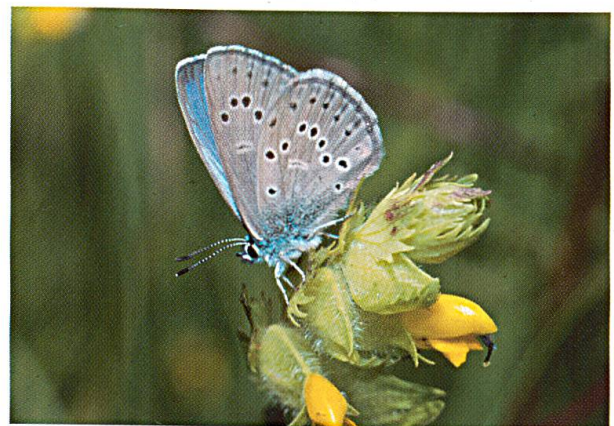
Abbildung 7: Hochmoor-Perlmutterfalter (links) und Kleiner Moorbläuling (rechts). (Fotos aus dem Planungsamt AR).