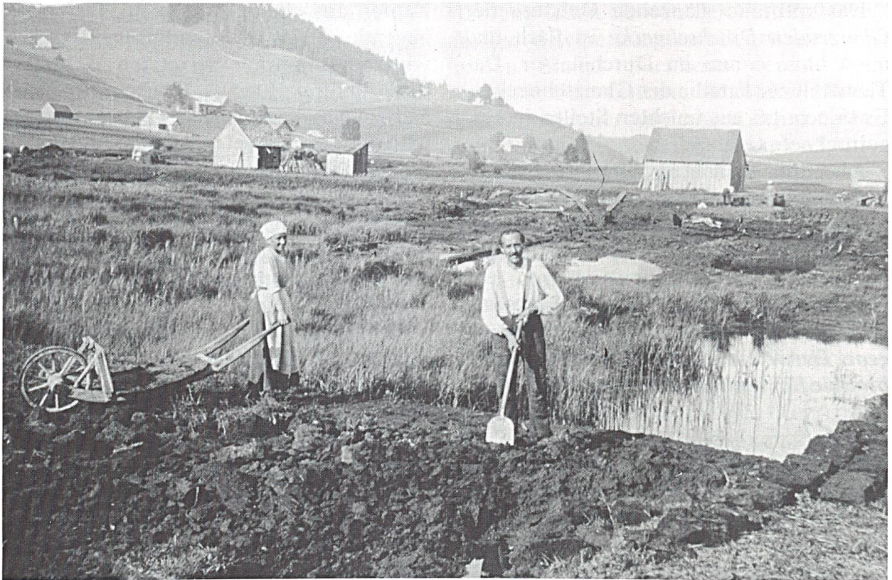
Abbildung 8: Torfstecher im Gontenmoos, vermutlich während der Ersten Weltkrieges.

Heute darf festgestellt werden, dass sich einzelne alte Torfstiche regeneriert haben und die Torfbildung wieder langsam fortschreitet. Dies gilt natürlich nur dort, wo das Wasser nicht abgeleitet und der alte Torfstich in keiner Weise bewirtschaftet wird. Ohne Torfabbau wären einzelne Moore in der Zwischenzeit in ihrer natürlichen Sukzession weitergeschritten und heute zu Wald geworden.