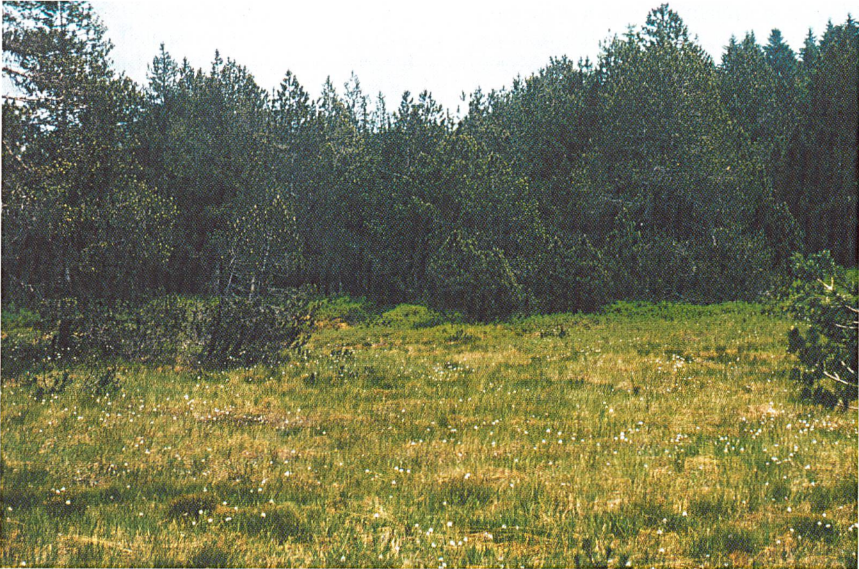
Abbildung 4: Hochmoor Suruggen/Trogen, mit Scheiden-Wollgras und aufrechten Bergföhren.