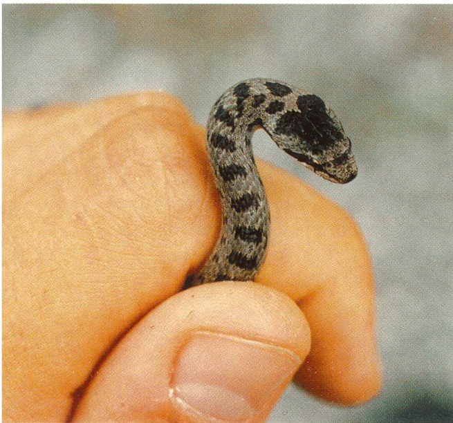
Abbildung 6: Juveniles Exemplar mit ausgeprägter Zeichnung.

Die maximale Gesamtlänge (Tabellen 3 und 4) der untersuchten Exemplare betrug bei den ♂♂ 662 mm, bei den ♀♀ 674 mm. Durch-