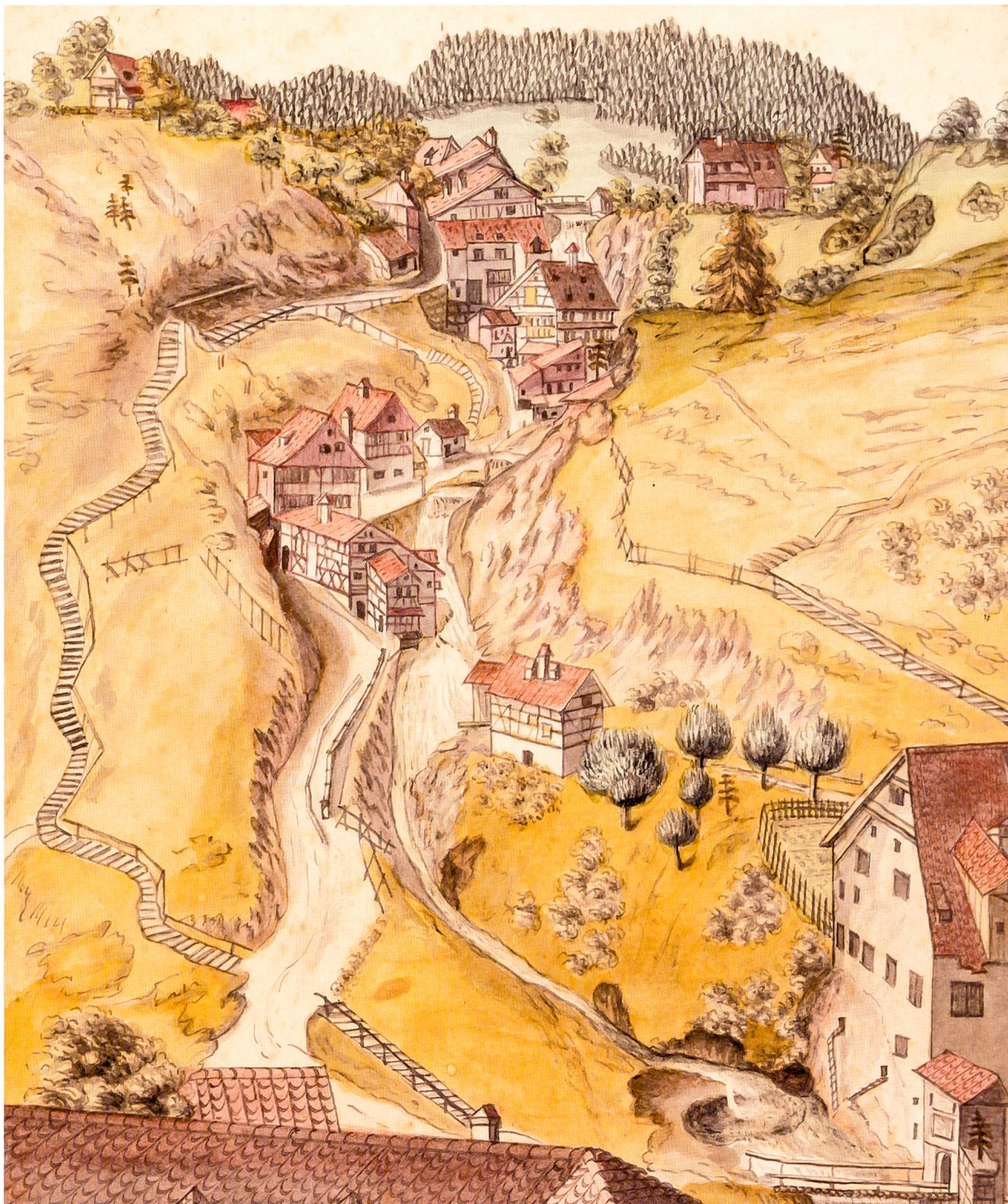
Abbildung 5: Mülenenschlucht von Norden. Kolorierte Radierung von Johannes Hädener, 1789. (Kantonsbibliothek St.Gallen, GS o 2 J/6)

staltung des oberen Steinachtales zu einer frühen Industrielandschaft wesentlichen Anteil hatte. Von der dort zur Verfügung stehenden Wasserkraft machten indes auch die Eigentümer anderer Gewerbe- und Industriebetriebe Gebrauch. Genannt werden sie beispielsweise in einem Vertrag vom