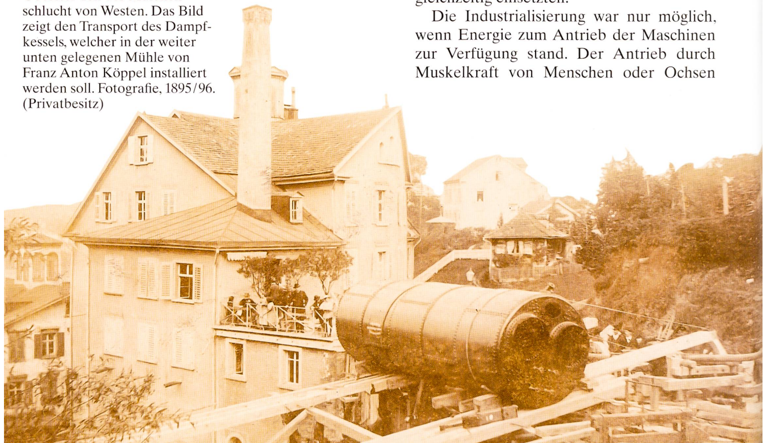
Abbildung 6: Oberster Teil der Mülenschlucht von Westen. Das Bild zeigt den Transport des Dampfkessels, welcher in der weiter unten gelegenen Mühle von Franz Anton Köppel installiert werden soll. Fotografie, 1895/96. (Privatbesitz)

Die Industrialisierung war nur möglich, wenn Energie zum Antrieb der Maschinen zur Verfügung stand. Der Antrieb durch Muskelkraft von Menschen oder Ochsen