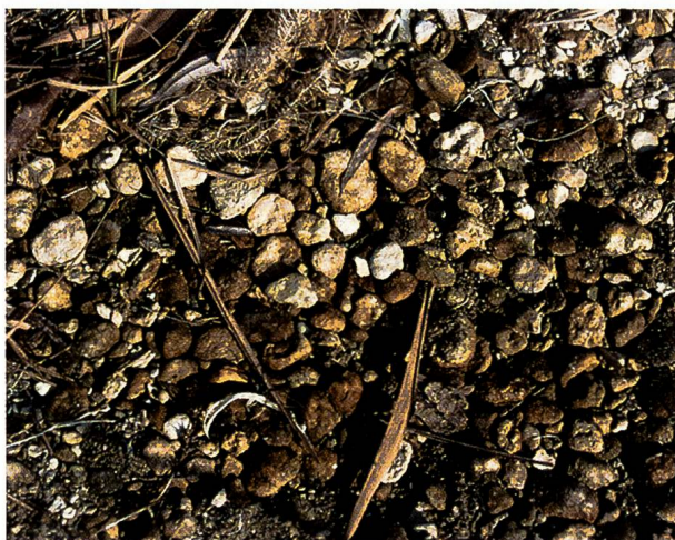
Abb. 2. Schnegglisande in der Uferzone der Insel Werd.

Inseln, die im Winter meist trockenfallen.» Im Gegensatz zu den Kalktuffen können die Schnegglisande im stehenden bis langsam sich bewegenden Wasser oder bei amphibischen Bedingungen aufgebaut werden. Ältere Autoren schätzen die Dauer der lebenden Algenphase der Schnegglisande für grössere Stücke auf gegen 20 Jahre. Mehrere Meter mächtige tote Schnegglisand-Ablagerungen, wie sie etwa die dem Wollmatinger Ried vorgelagerte, schilfbestandene Insel Langenrain aufbauen, weisen auf Prozesse hin, die über Jahrtausende andauerten. Baumann kommt geradezu ins Schwärmen, wenn er diese vegetabilischen Inseln in Analogie zu den Koralleninseln der Ozeane setzt. Kalktuffablagerungen, Schnegglisandbänke und Erosionstrümmer sollen den «Hauptteil des Seeschlammes und der Seekreide» ausmachen und haben die Morphologie des Unterseebeckens (besonders dessen allmähliches Ausfüllen und die Ufergestaltung) wesentlich mitgeprägt. Bemerkenswert ist auch die Angabe von Baumann, der damals auf Schnegglisandufern der Insel Langenrain die heute bedrohte, vivipare Bodensee-Charakterart Strand-Schmiele «in grosser Menge» fand (DIENST et al., 2004 und in diesem Buch). Interessant ist allerdings, dass Strandrasen-Gesellschaften heute nicht mehr auf Schnegglisanden vorzukommen scheinen (DIENST mündl.). Als indirekte Ursache vermutet er die Schilfausbreitung und sein dichteres Wachstum auf diesen Standorten.