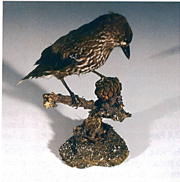
Abbildung 3: Tannenhäher mit Arvenzapfen. Präparat aus dem Bestand des Natur- museums St.Gallen.

Im Verband als Bannwald erfüllen die Bäume wichtige Aufgaben. Sie tragen zur Wasserregulierung bei, sie verbessern das Klima durch Windschutz, Wasserabdunstung und Wärmeregulierung. Sie bieten auch Schutz vor Lawinen und Murgängen. Sie bieten Unterschlupf für viele Tiere, haben offensichtlich nichts dagegen, wenn in hartem Winter Gämsen ein paar Nadeln fressen. Sie bieten ihre Nüsschen dem Tannenhäher, dem Eichhörnchen, der Maus an. Als alpiner