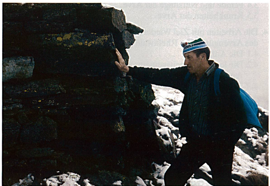
Abbildung 1: Reste der Trocken- mauer des Hochofens unterm Wänglispitz auf 2350 m ü.M.. Hier wurde Eisen aus dem Erz des Wänglispitzes verhüttet.

In vorwalscherer Zeit war das Tal oberhalb der Roflaspflucht, das Rheinwald, nur spärlich besiedelt. Flurnamen wie ‹Casana, Casanna, akkadisch: qassu = geweiht, den Göttern geweiht› (BRUNNER 1987), weisen auf ein vorrömisches, semitisches Volk aus der Gegend nördlich Babylons hin. Im frühen Mittelalter besass das Kloster Roveredo eine kleine Aussenstation in Hinterrhein. Die Hausbezeichnung ‹Chlöschterli› erinnert noch heute daran. Im Jahr 1274 verpflichteten die damaligen Landesherren von Sax Misox 13 Walscherfamilien vorwiegend aus dem Pomatt, dem heutigen Val Formazza, Italien, nach Hinterrhein zur Offenhaltung des Transits über den San Bernardino Pass im Winter. Sie gewährten den Walschern Sonderrechte wie persönliche Freiheit, niedrige Gerichtsbarkeit, Rodefreiheit zur Kultur- und Weidelandgewinnung. Reste des Hochofens (Abbildung 1) unter dem Wänglispitz auf 2350 m ü.M. bezeugen, dass dort oben Eisen abgebaut und geschmolzen wurde. Der verstorbene