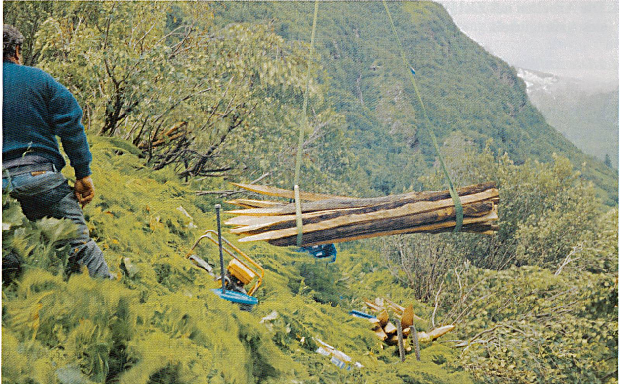
Abbildung 4: Helikoptertransport ins Chratzli am Guggernüll bei Nufenen. 3,5 m lange Wildschutzpfähle hängen am Seil des Helikopters und werden im steilen Pflanzgelände deponiert.