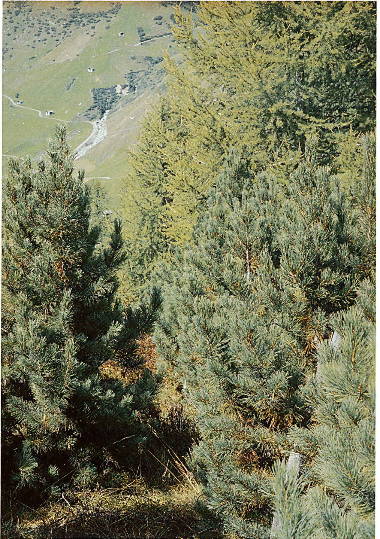
Abbildung 6: Arvenmischwald gegenüber der A13-Galerie Nufenen – Hinterrhein als Teil des Lawinen- schutzes.