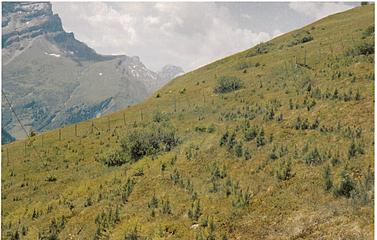
Abbildung 5: Pflanzung von Arven und Lärchen in Reihen ob dem Bender/Schnäggefäts oberhalb Medels i/R.