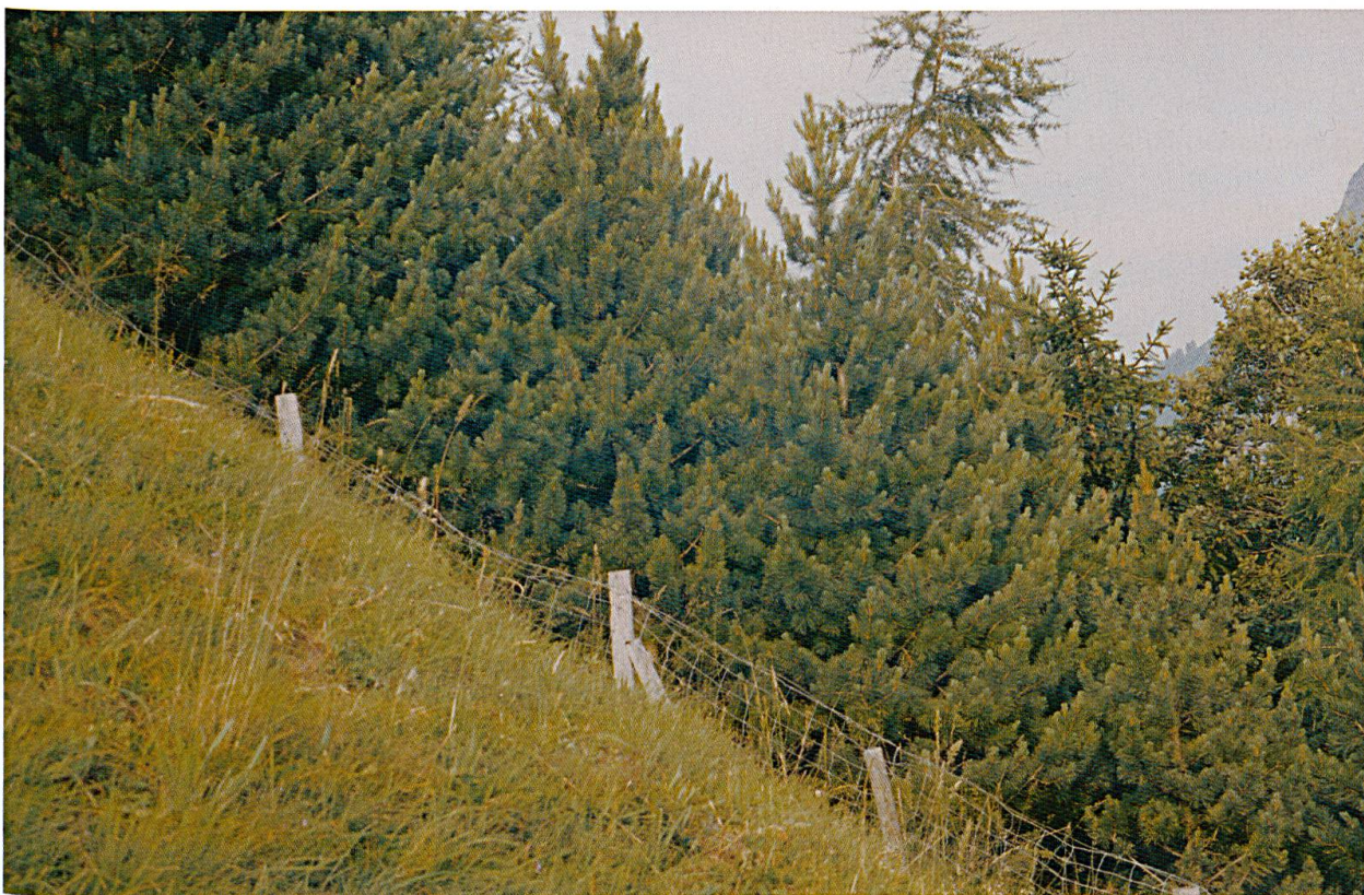
Abbildung 7: Pflanzung am alten Talweg zwischen Nufenen und Medels mit dem vorrömischen Namen ‹Trogia› (heute: ‹Trog› genannt, was akkadisch ‹am Weg› bedeutet [L. Brunner])

Aus bescheidenen Anfängen mit zuerst zaghafter Zielsetzung hat sich dank glücklicher Umstände ein solides Werk entwickelt. Es sind bis jetzt keine Unfälle zu beklagen. Die