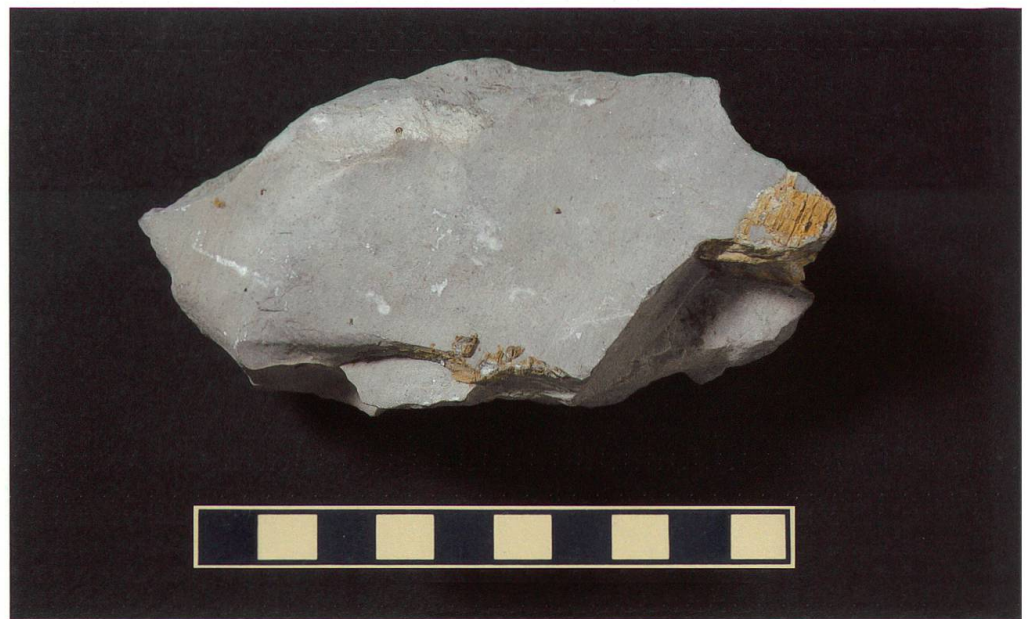
Abbildung 13: Fundplatte 11 vom Chäser- rugg, NMSG P 5782.11 weist eine Länge von 13 cm, eine Breite von 12 cm und eine Höhe von 3 cm auf. Auf ihr ist ein recht unvollständig erhaltener Wirbel zu sehen. Seine Masse betragen 42 x 18 x 7 mm. Der Mass- stab entspricht 10 cm.