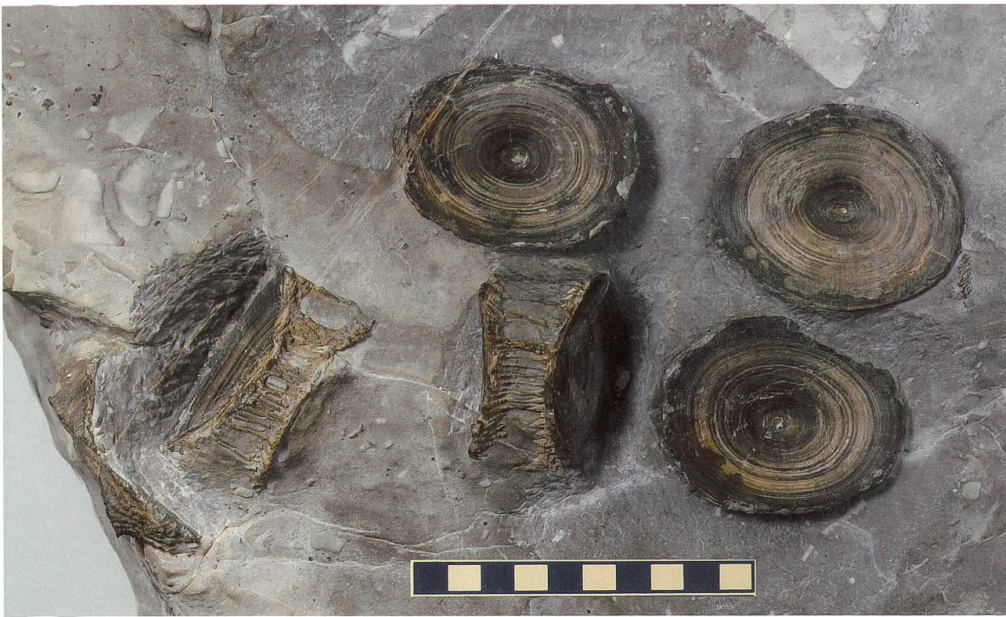
Abbildung 3: Fünf Wirbel der Fundplatte 1 vom Chäserrugg, NMSG P 5782.1 in Detailansicht. Deutlich zu erkennen sind die konzentrischen Wachstumsringe sowie die Artikulationsgruben für die paarigen Neural- und Hämalfortsätze. Der Massstab entspricht 10 cm.

Die Mehrzahl der Fundstücke befindet sich als Leihgabe des Kantons St.Gallen in der Sammlung des Naturmuseums St.Gallen (NMSG). Einige wenige Stücke mit einzelnen, meist unvollständigen Wirbeln befinden sich in drei Privatsammlungen. Die Platten Nr. 1 und Nr. 15 sind die einzigen, welche vor Ort an der