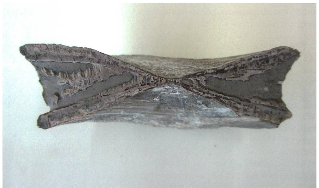
Abbildung 19: Querschnitt eines Wirbels von Fundplatte 7 vom Chäserrugg, NMSG P 5782.7, Durchmesser 72 mm.