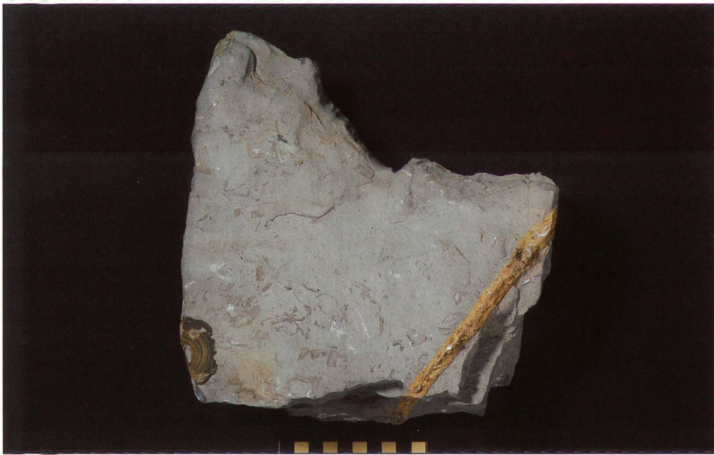
Abbildung 11: Fundplatte 9 vom Chäser- rugg, NMSG P 5782.9 weist eine Länge von 24 cm, eine Breite von 25 cm und eine Höhe von 9,5 cm auf. Auf ihr ist ein unvollständig erhalte- ner Wirbel zu sehen. Dessen Masse betragen 59 x 45 x 17 mm. Der Massstab entspricht 10 cm.