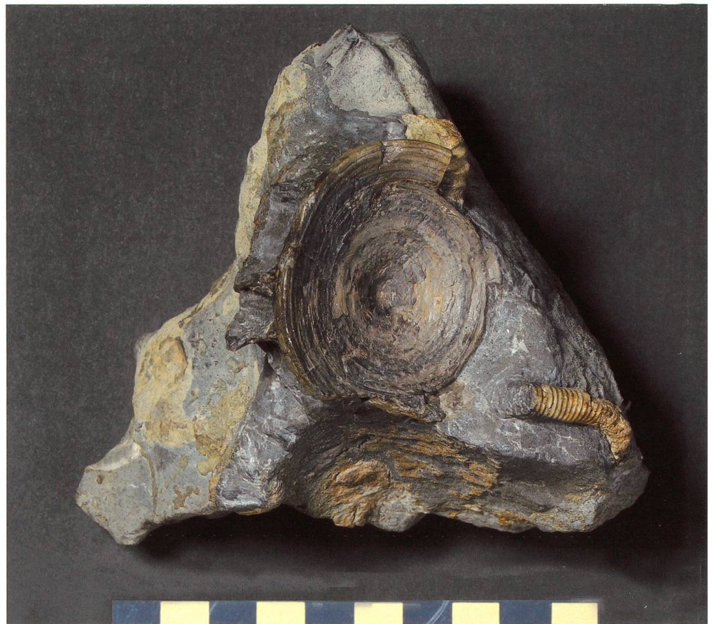
Abbildung 23: Wirbel vom Säntis NMSG P 5739.1, rechts befindet sich ein Ammonit ( Hamites sp.), aus Schutt der Garschella Formation. Der Massstab entspricht 10 cm.

In der späten Kreidezeit waren weite Teile der heutigen Schweiz von einem Ozean bedeckt (WEISSERT & STÖSSEL 2009). Das Ablagerungsmilieu der Seewen-Formation wird als Schelfbereich eines offenen Meeres interpretiert. Dank günstigeren geologischen Erhaltungsbedingungen, ist die Lebewelt der mittleren und oberen Kreide der USA allerdings weitaus besser bekannt als durch die spärlichen Funde in Europa. Durch die gute Erhaltung der dortigen Fossilfunde konnten dort deutlich mehr Taxa nachgewiesen werden (EVERHARDT 2005). Die Meere der späten Kreidezeit waren somit mit reichem Leben erfüllt. An der Spitze der Nahrungsket-