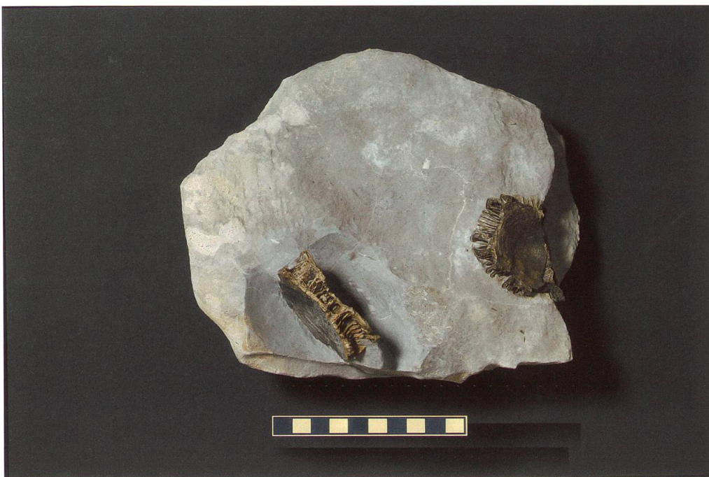
Abbildung 10: Fundplatte 8 vom Chäser- rugg, NMSG P 5782.8 weist eine Länge von 21 cm, eine Breite von 18 cm und eine Höhe von 8,5 cm auf. Auf ihr sind zwei unvollständig erhaltene Wirbel zu sehen. Deren Masse betragen 59 x 45 x 17 mm und 62 x 49 x 16 mm. Der Mass- stab entspricht 10 cm.