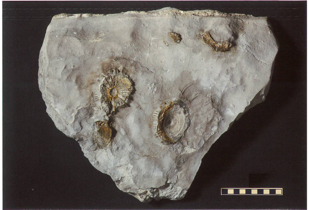
Abbildung 7: Fundplatte 5 vom Chäserugg, NMSG P 5782.5 weist eine Länge von 39 cm, eine Breite von 32 cm und eine Höhe von 8 cm auf. Auf ihr sind ein nahezu vollständiger und drei unvollständige, stark verwitterte Wirbel zu sehen. Deren Masse betragen 69 x 55 x 10 mm, 70 x 63 x 9 mm, 48 x 18 x 9 mm und 43 x 26 x 12 mm. Der Massstab entspricht 10 cm.