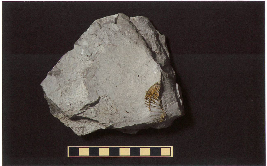
Abbildung 15: Fundplatte 13 vom Chäser- rugg, NMSG P 5782.13 weist eine Länge von 10,5 cm eine Breite von 6 cm und eine Höhe von 3,5 cm auf. Auf ihr ist ein sehr unvollständig erhaltener Wirbel zu sehen. Seine Masse betragen 38 x 13 mm. Der Massstab entspricht 10 cm.