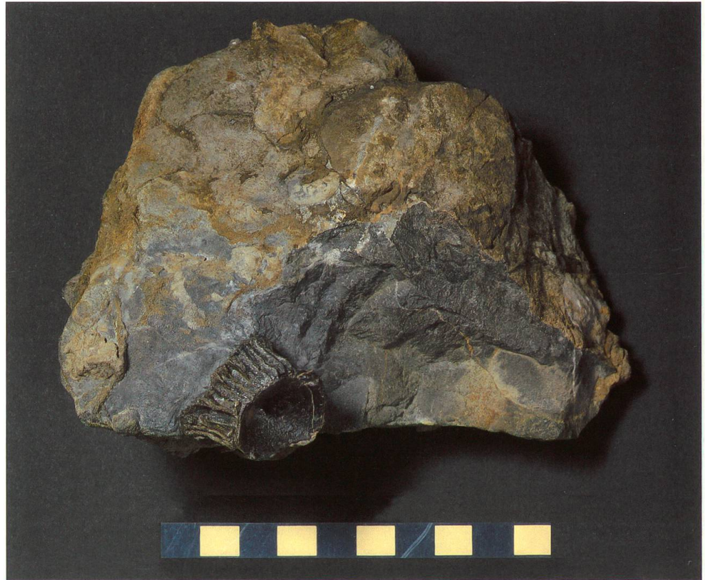
Abbildung 24: Wirbel vom Säntis NMSG P 5739.2, aus Schutt der Garschella Formation. Der Masstab entspricht 10 cm.

te standen grosse marine Reptilien wie Mosasaurier und Pliosaurier sowie grosse Hochseehaie wie Cretoxyrhina mantelli . Über der Wasseroberfläche flogen riesige Flugsaurier wie Pteranodon . Daneben gab es eine grosse Zahl an unterschiedlichsten Knochenfischen und Wirbellosen. Am häufigsten aber war das Plankton, insbesondere die planktonischen Foraminiferen, die den grössten Teil des Kalkschlamms geliefert haben, in welchem auch die Haifunde aus den Churfürsten eingebettet wurden.