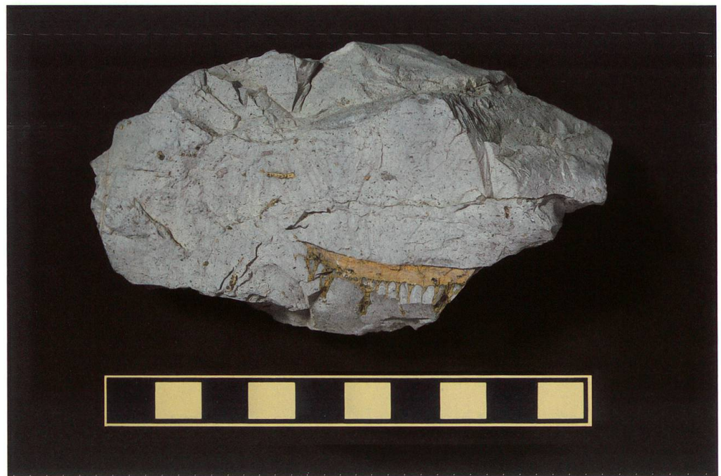
Abbildung 12: Fundplatte 10 vom Chäser- rugg, NMSG P 5782.10 weist eine Länge von 19 cm, eine Breite von 12,5 und eine Höhe von 4 cm auf. Auf ihr ist ein unvollständig erhalte- ner Wirbel zu sehen. Seine Masse betragen 46 x 30 x 18 mm. Der Massstab entspricht 10 cm.