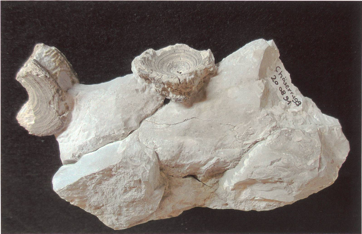
Abbildung 2: Zwei, am 20. August 1991 von D. Müller gefundene Wirbel vom Chäserrugg. Das Fundstück ist 16 cm lang, 16 cm breit und 6 cm dick und befindet sich in der Privatsammlung von Urs Oberli. Einer der beiden Wirbel mit einem Durchmesser von ca. 55 mm und einer Höhe von 23 mm ist halbiert und angewittert, der andere, mit einem Durchmesser von ca. 39 mm und einer Höhe von 16 mm, ist am Rande stark angewittert.

geborgen. An einer anderen grossen Platte, nahe beim Hauptfund, konnte zudem der Rest eines Zahns aus dem Stein gemeisselt werden. Bei der anschliessenden Präparation der grossen Platte kamen insgesamt 13, mehr oder weniger vollständig erhaltene Wirbel zum Vorschein (Abbildung 1).