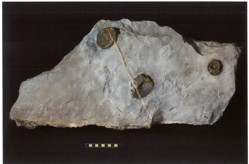
Abbildung 4: Fundplatte 2 vom Chäserrugg, NMSG P 5782.2 weist eine Länge von 75 cm, eine Breite von 45 cm und eine Höhe von 14 cm auf. Sie lag am nächsten bei Platte Nr. 1. Auf ihr sind zwei recht gut erhaltene Wirbel zu erkennen, welche durch eine alpine tektonische Calcitader durchschnitten sind. Der dritte Wirbel ist an den Rändern stark verwittert. Ihre Masse betragen 69 x 54 x 25 mm, 70 x 47 x 22 mm und 48 x 42 x 15 mm. Der Massstab entspricht 10 cm.