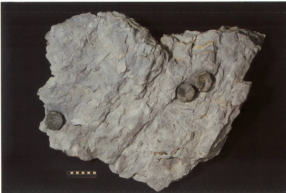
Abbildung 16: Fundplatte 14 vom Chäs- errugg, NMSG P 7037.1 stammt aus einer etwas höheren Lage als der Hauptfund und wurde erst bei der Bergung der grossen Platte entdeckt. Sie weist eine Länge von 88 cm, eine Breite von 64 cm und eine Höhe von 10 cm auf. Auf ihr sind drei nahezu vollständig erhaltene Wirbel zu sehen. Deren Masse betragen 66 x 60 x 17 mm, 66 x 65 x 17 mm und 62 x 57 x 18 mm auf. Der dritte Wirbel weist einen tektonischen Bruch quer durch den Wirbelkörper auf. Der Massstab entspricht 10 cm.