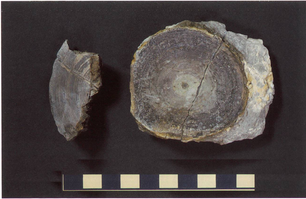
Abbildung 17: Fundplatte 15 vom Chäserugg, NMSG P 7037.2 weist eine Länge von 7 cm auf. Auf ihr ist ein nahezu vollständig erhaltener Wirbel zu sehen. Seine Masse betragen 60 x 58 x 20 mm. Sie wurde etwas oberhalb von Platte 14 im Erdreich gefunden. Der Massstab entspricht 10 cm.

originalen Lage gefunden wurden. Alle übrigen Funde stammen aus dem umliegenden Blockfeld und zum Teil aus einer Doline. Auf einzelnen Platten sind zudem die Schalenreste grosser Muscheln (Inoceramen) zu erkennen.