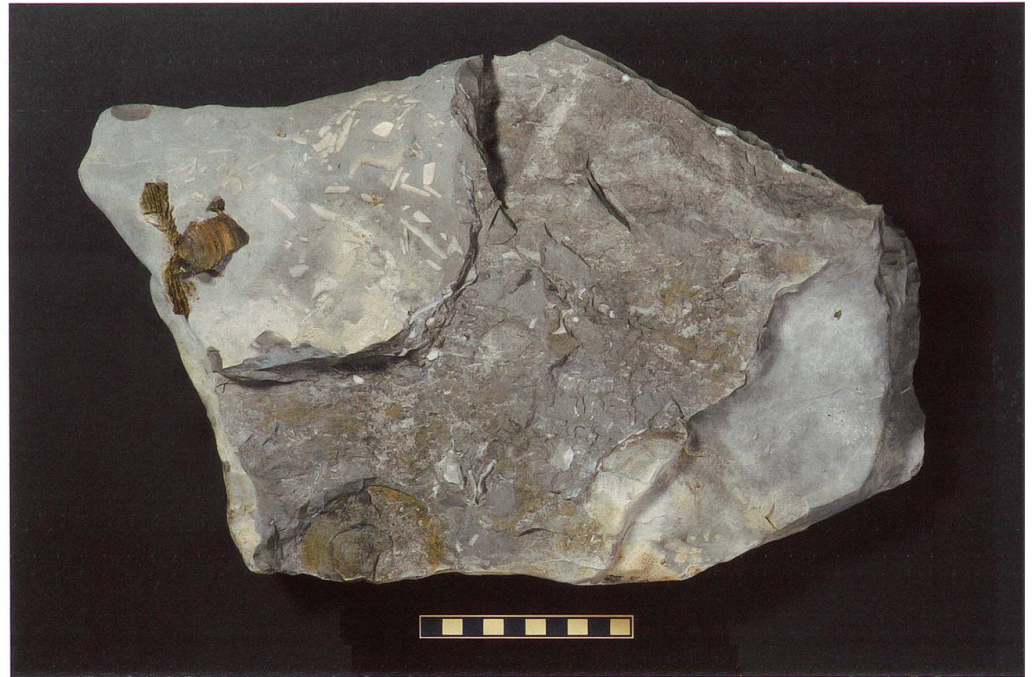
Abbildung 9: Fundplatte 7 vom Chäser- rugg, NMSG P 5782.7 weist eine Länge von 38 cm, eine Breite von 25 cm und eine Höhe von 7 cm auf. Auf ihr sind ein unvollständiger, stark verwitterter Wirbel und ein Wirbelabdruck zu sehen. Deren Masse be- tragen 61 x 40 x 7 mm und 65 x 44 mm. Der über dem Abdruck liegende unvoll- ständige Wirbel wurde für die Gewinnung eines Quer- schnitts wegpräpariert. Der Massstab entspricht 10 cm.