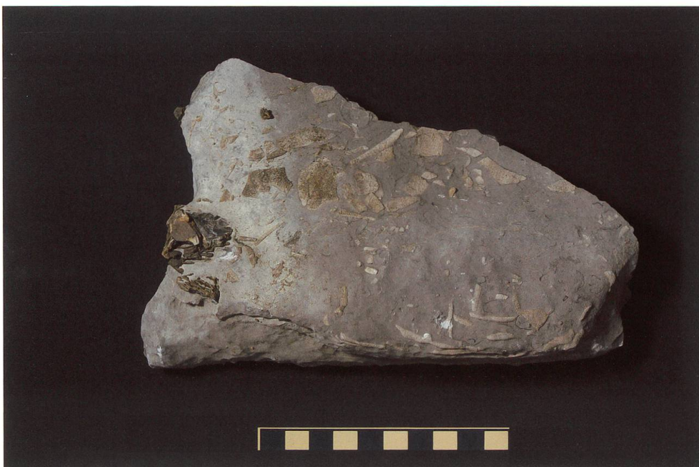
Abbildung 14: Fundplatte 12 vom Chäser- rugg, NMSG P 5782.12 weist eine Länge von 12 cm, eine Breite von 7 cm und eine Höhe von 3 cm auf. Auf ihr sind zwei sehr unvoll- ständig erhaltene Wirbel zu sehen. Ihre Masse betra- gen 38 x 22 x 12 mm und 36 x 12 x 10 mm. Der Mass- stab entspricht 10 cm.