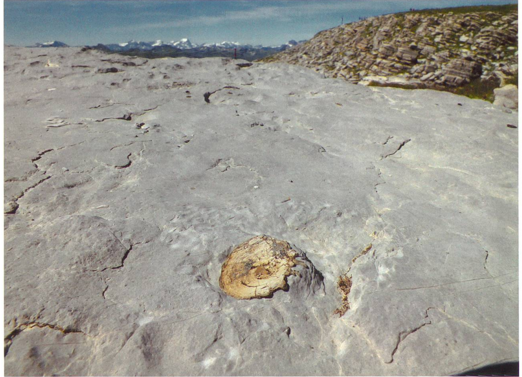
Abbildung 21: Fund vom Hinterrugg während der Bergung durch Urs Oberli.

der Seewen-Formation auf dem Hinterrugg ebenfalls fossile Haiwirbel entdeckt. Sie weisen aber einen deutlich kleineren Durchmesser auf als diejenigen vom Chäserrugg (Abbildung 21). Neben der nahezu quadratischen