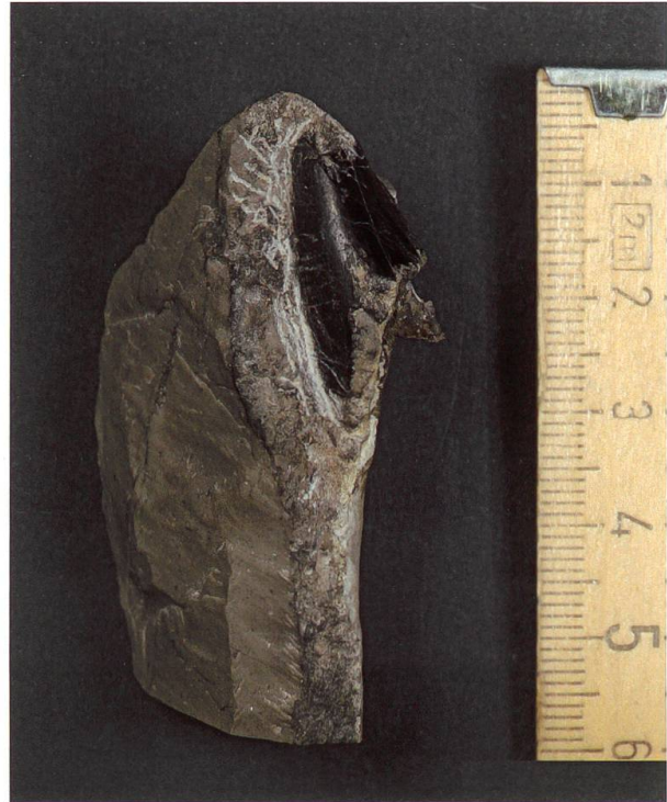
Abbildung 20: Einzelner Zahn von Chäserrugg, NMSG P 5782.14

Selachier besitzen nur schwach mineralisierte Knorpelskelette, das heisst, das Skelett zerfällt nach dem Tod im Normalfall sehr rasch. Meist aber lagert sich im Laufe des Wachstums, speziell an stark belasteten Stellen im Skelett, zusätzlich Kalzium-Phosphat ein, um dem Skelett mehr Stabilität zu verleihen. Deshalb findet man von Haien viel häufiger Wirbelkörper, als andere Teile des Skeletts. Insgesamt werden die harten, mineralisierten Zähne aber weitaus am häufigsten gefunden (SHIMADA 2007). Im vorliegenden Fall verhält es sich gerade umgekehrt. Bisher wurde lediglich ein einzelner, unvollständig erhaltener Zahn gefunden (Abbildung 20). Er wurde aus einer nahe der Hauptplatte liegenden, anderen grossen Kalkplatte der Seewen-Formation freigelegt. Da er nur teilweise erhalten ist, bleibt auch die Beschreibung unvollständig. Der erhaltene Zahnrest weist eine Höhe von 25 mm, eine Breite von 13 mm und eine Tiefe von 7 mm auf. Es fehlen die Spitze und die Basis. Deutlich sichtbar ist eine scharfe Kante auf der rechten Seite. Aufgrund der vorhandenen Merkmale kann von einer Zugehörigkeit zur Familie Lamnidae ausgegangen werden.