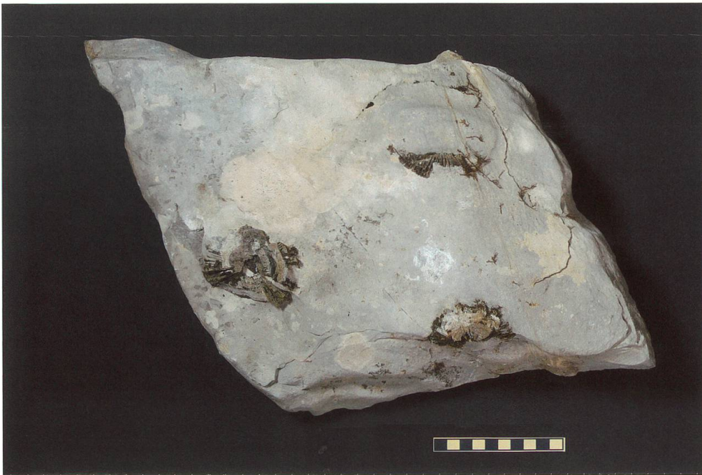
Abbildung 8: Fundplatte 6 vom Chäserugg, NMSG P 5782.6 weist eine Länge von 39 cm, eine Breite von 28 cm und eine Höhe von 12 cm auf. Auf ihr sind drei unvollständige, stark verwitterte Wirbel zu sehen. Deren Masse betragen 53 x 23 x 7 mm, 72 x 54 x 22 mm und 62 x 34 x 14 mm. Der Massstab entspricht 10 cm.