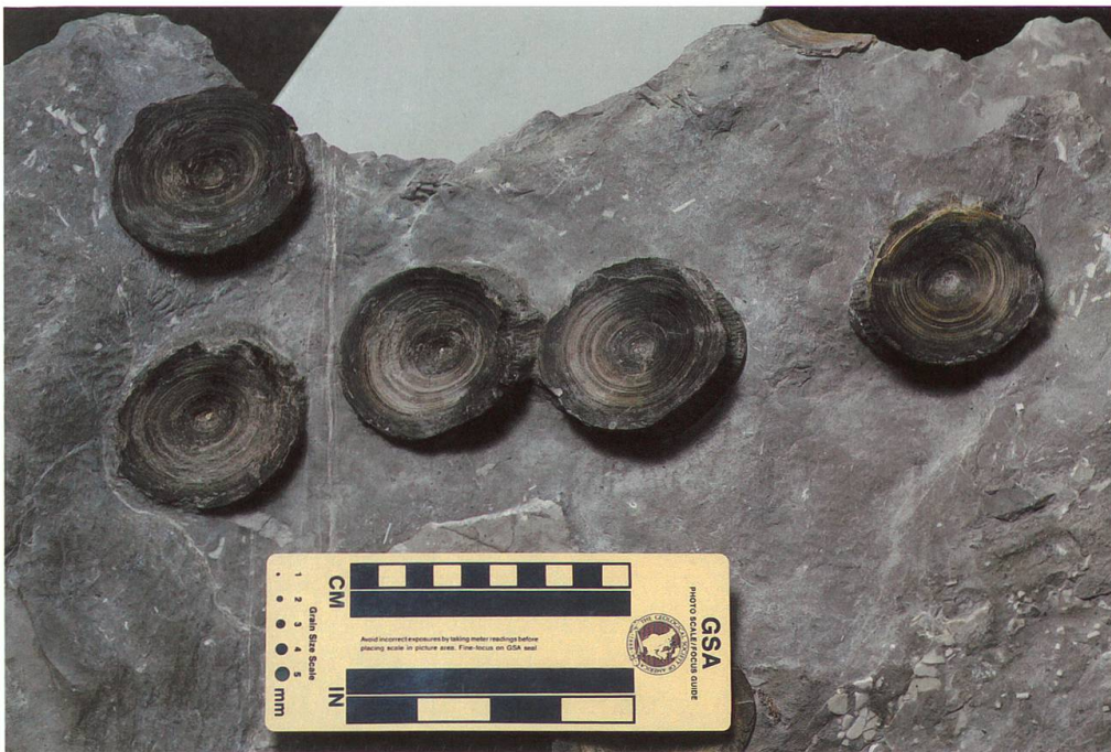
Abbildung 18: Fünf Wirbel von Fundplatte 1 vom Chäserrugg, NMSG P 5782.1 in Detailansicht.

det (BLANCO-PINON et al. 2005, COOK et al. 2011). Sogar gewisse ontogenetische Muster, wie etwa den Zeitpunkt der Geburt, lassen sich aus der Analyse dieser konzentrischen Zuwachsringe ableiten (SHIMADA 2008). Eine aktuelle Studie (HAMADY et al. 2014) meldet nun aber berechtigte Zweifel bei der Zuordnung eines Wachstumsrings zu einem Jahr an. Aufgrund radioaktiver Spu-