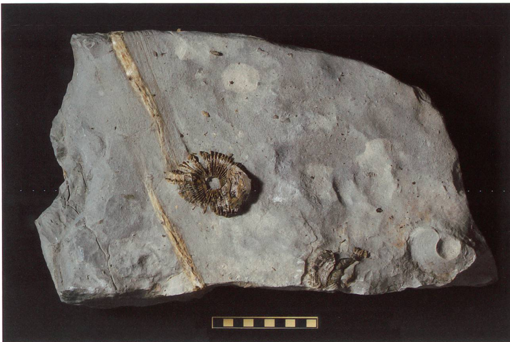
Abbildung 6: Fundplatte 4 vom Chäser- rugg, NMSG P 5782.4 weist eine Länge von 45 cm, eine Breite von 25 cm und eine Höhe von 10 cm auf. Diese Platte weist zwei deutliche, versetzte Calcitbänder auf. Auf ihr sind zwei unvollständ- ige, stark verwitterte Wirbel sowie der Abdruck eines dritten Wirbels zu sehen. Deren Masse betragen 74 x 58 x 9 mm, 63 x 41 x 9 mm und 64 x 45 mm. Der Massstab entspricht 10 cm.