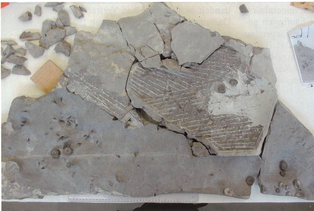
Abbildung 22: Fund vom Hinterrugg während der Präparation.