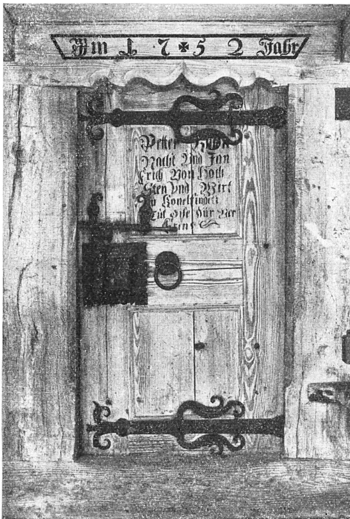
Abb. 6. Speicher. Ober Schönenwasen b. Gr. Höchstetten.

Es drängt sich nun auch die Frage auf: sind diese Türen in der Gemeinde des Schenkenden gemacht und dann zum Neubau gebracht worden, oder haben sie der Zimmermann oder Schreiner an Ort und Stelle verfertigt. In diesem Falle hätte dann der Donator lediglich die Tagelöhne bezahlt oder dem Bauherrn wenigstens einen gewissen Geldbetrag geschenkt. Genaue Nachrichten liegen hierüber leider keine vor. Aus dem Umstand aber, dass so häufig die Ehrennamen der Geber verzeichnet sind, muss geschlossen werden, dass der Beschenkte über die Ausführung des Gegenstandes verfügte, dass der Handwerker bei