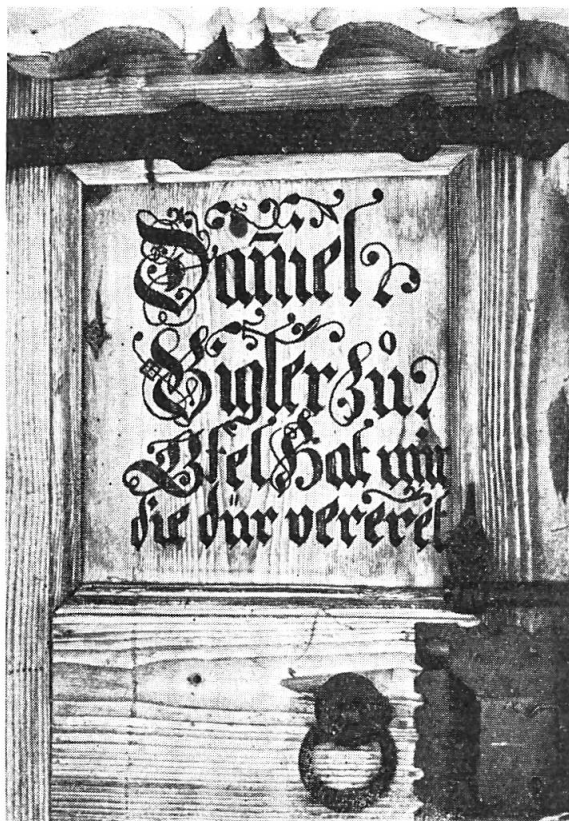
Abb. 7. Speicher. Ober Schönenwasen 1752.