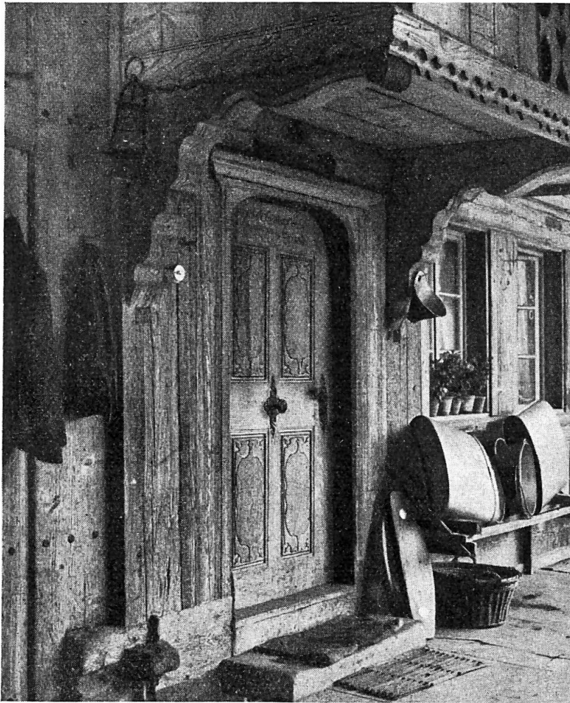
Abb. 1. Haus Familie Rothenbühler, Rüderswil 1775.