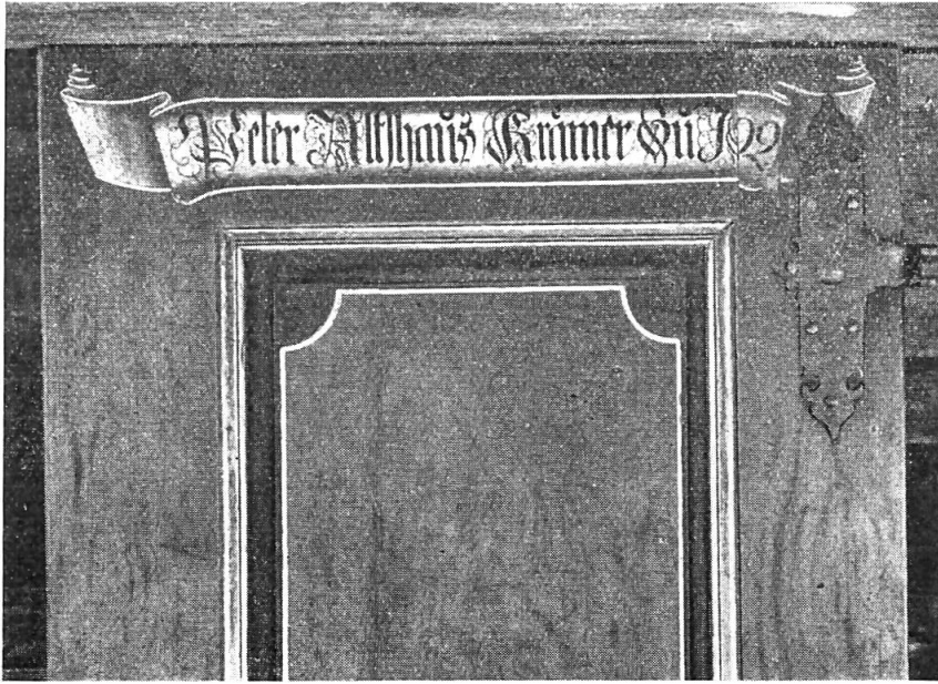
Abb. 2. Haus Althaus, Rüderswil 1792. Phot. R. Marti-Wehren.

selber ist, wie alle andern des Hauses, rötlich maseriert, der Stab um die Füllung ist bläulich, das Filet in gedämpftem Weiss gehalten. Die Schrift auf dem dunkelschattierten weissen Spruchband ist schwarz. Die drei andern Türen tragen folgende Inschriften: