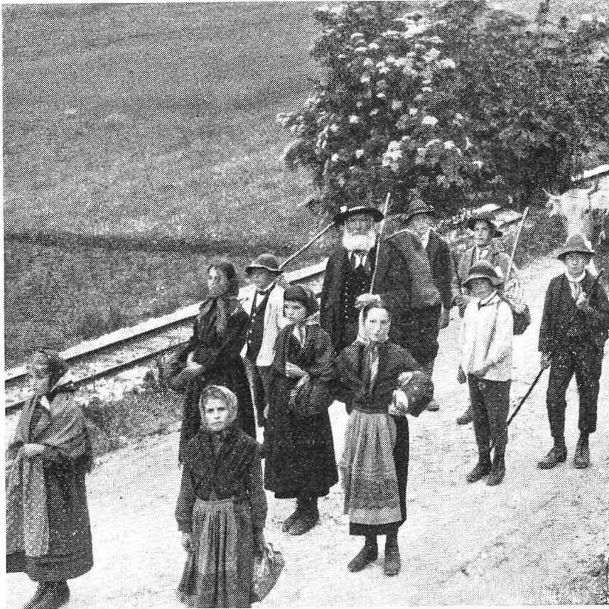
Abb. 9. „Schwabengänger“ im Festzug der Centenarfeier in Truns 1924.

Von ihrem Onkel, vom „Aetter Philipp“, erzählte mir die Base Clementina, er sei schon als 6jähriges Büblein mitgegangen. Er war gross für sein Alter, und so meinte die Mutter: „Du