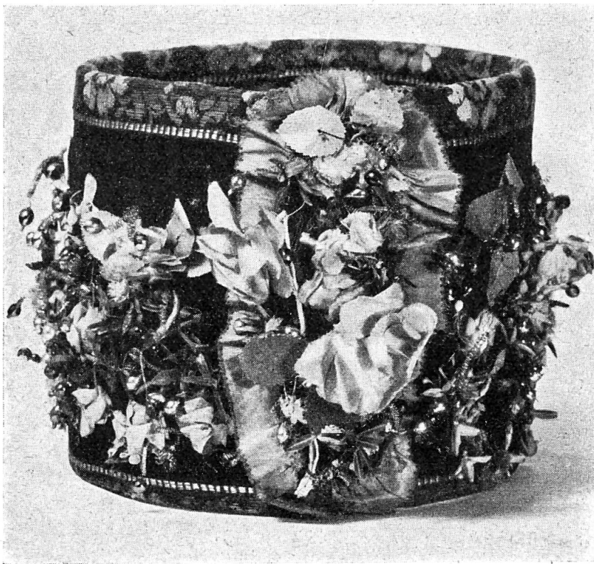
Fig. 7. Das Bertli, die Brautkrone aus dem Haslimuseum.

Das Börtli, Bertli oder Birtli. Das Haslimuseum bewahrte aber noch einen Kopfschmuck auf, der als „Brautkrone vom Hasliberg“ bezeichnet war. Die Forschung erklärte ihn als unecht.