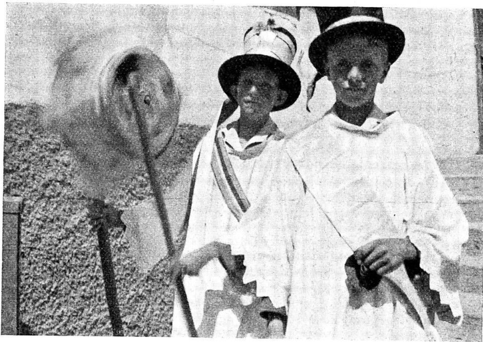
Abb. 3. Der Sterndreher trägt Chorknabenhemd (aus der Kirchengarderobe), Zylinder und Band. Der Kassier gleich gekleidet, mit dem Geldseckel.