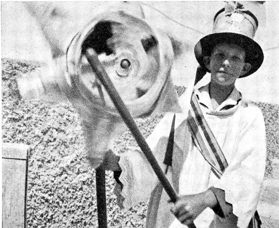
Abb. 1. Der Sterndreher (Stern alt und gross); er trägt Chorhemd u. Zylinder (schwarz) mit lang herabfallendem Band geschmückt; das Band ist mit Papiersternen, also kokardenmässig verziert.

Hanns in der Gand. Ir culla Steila in Stürvis. — H. G. Wackernagel, Vom fastnächtlichen Uristier. — J. Bielander, Die Schafkollekte der Kapuziner im Goms. — J. Bielander, Die Nachtpolizei über die Minderjährigen. — J. Arnet, Der hl. Eligius, Bischof von Noyon. — H. G. Wackernagel, Vom Hakenkreuz im Mittelalter. — Vom Leichenbitten. — Fragen und Antworten. — Bücherbesprechungen.