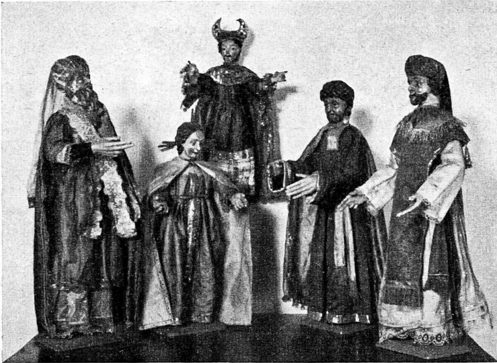
Jesus im Tempel.