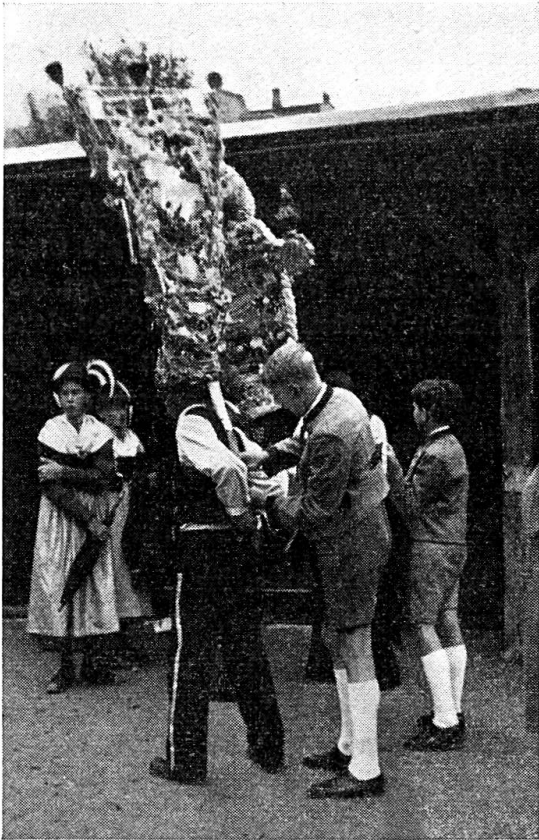
Abb. 7. Der Kopfschmuck einer Vogelpercht wird rückwärts am Gürtel befestigt.