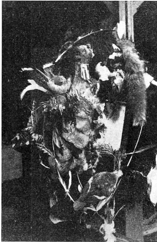
Abb. 6. Kopfschmuck einer österreichischen Vogelpercht.