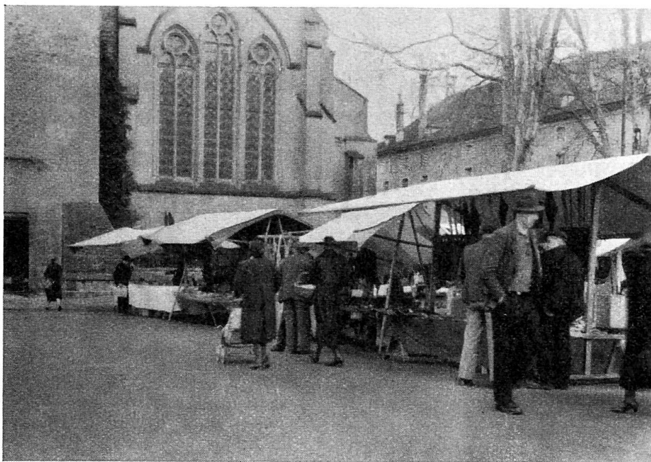
Fig. 1. Bancs de foire, à droite l'Arsenal (où avaient lieu autrefois les écoles cantonales de tambours militaires).

Autrefois (il y aura bien trois quarts de siècle), la vente du beurre avait une certaine importance, beurre de fabrication domestique qu'une femme ou un enfant était chargé de vendre pour le compte des producteurs du village; chaque ménagère savait alors parfaitement qui apportait au marché le meilleur beurre.