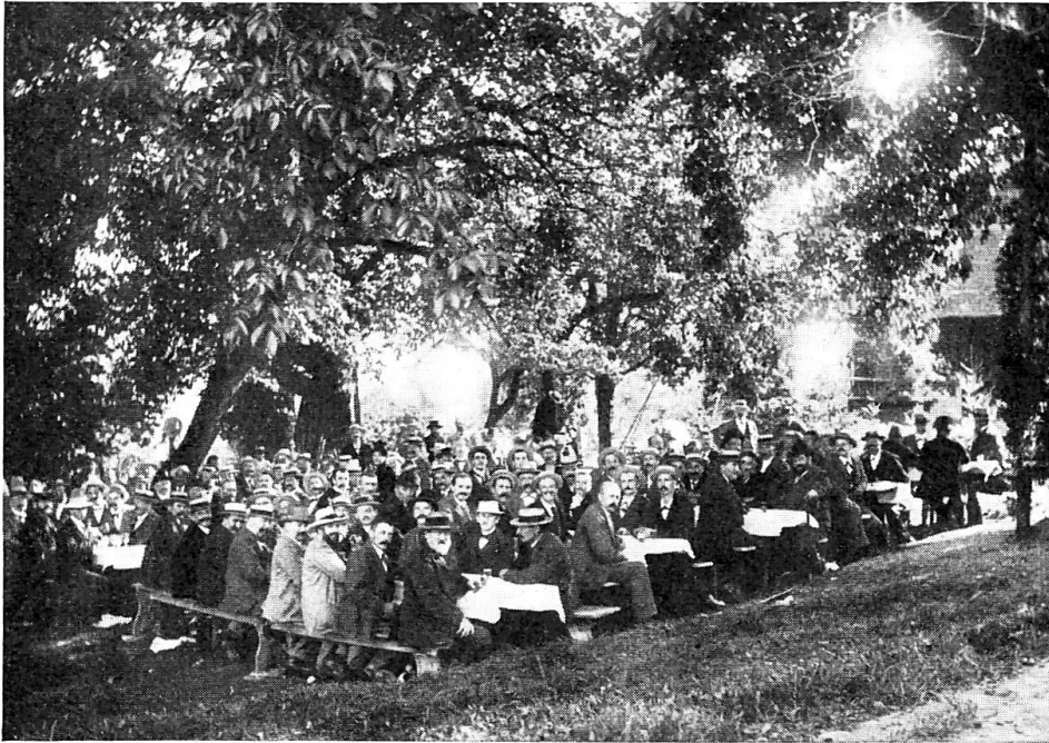
Fig. 4. Banquet de Cornier, vers 1895.

Primitivement le vin était offert par la commune et transporté sur place la veille du grand jour: dépourvu de gardes vigilantes, il était souvent l'objet de trop fortes convoitises, ce qui engagea les organisateurs à prendre d'autres mesures. Après le banquet, ce qui restait était abandonné aux fermiers, généralement ceux-ci se battaient autour du tonneau presque vide. Inutile de dire que de nos jours on ne tolérerait pas de telles scènes.