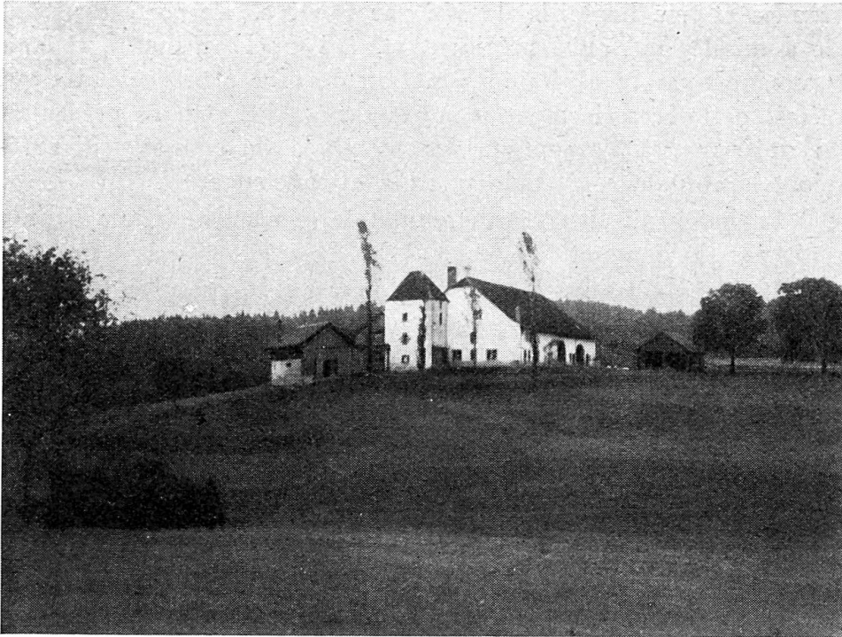
Fig. 3. Moudon: Ferme de la Cerjaulaz, Propriété communale.

En temps de paix, le menu est aussi plantureux que soigné, arrosé des meilleurs crus. Les fastes moudonnoises parlent encore de cuisiniers qui, à cette occasion, tenaient à se surpasser: tel Jean Boudry, le sympathique tenancier de l'auberge du Mouton, dont la salle à boire était ornée d'un buste doré représentant J. J. Rousseau, buste autrefois fixé à la poupe d'un des bateaux à vapeur naviguant sur le lac de Bienne.