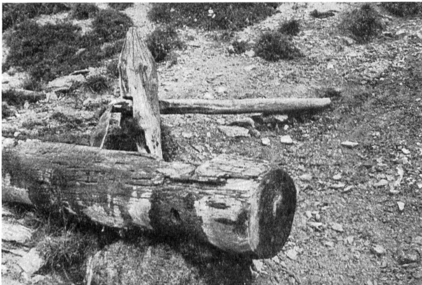
Tränkbrunnen ausserhalb des Dorfes am Strässchen zu den Maiensässen (prümarangs) von Ardez.

Am Brunnen treffen sich die Frauen, welche Wasser für die Küche holen und waschen, die Männer, welche das Vieh tränken, und die Kinder, welche am Wasser spielen. Dem Wanderer aber, der von der heissen, sonnigen Landstrasse in den Schatten des Dorfes eintritt, kann am Brunnen das Gleichnis vom Wasser des Lebens verständlich werden.