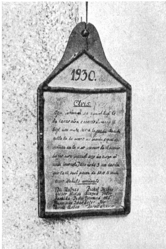
Brunnentafel (tabla d'bügl) der Brunnengenossenschaft des Platzbrunnens (bügl plaz) in Guarda.

schaft reihum. Wenn eine Haushaltung am Samstag den Brunnen geleert und gefegt hat, so gibt sie die Verpflichtung dem Nachbarhaus weiter, indem sie dorthin die „tabla d'bügl“, die Brunnentafel (vgl. Abbildung), als konkrete Mahnung überbringt. Die Brunnentafel hängt dann dort die Woche über im Hausgang. Die „tabla d'bügl“ gehört somit zu jenen uralten Holzurkunden, und zwar zur Gruppe der Pflichthölzer oder Kehrtesseln, die sich in der Schweiz auch in der Funktion von Eigentumshölzern (Alptesseln) und Rechnungshölzern als primitives Relikt bis in die Neuzeit erhalten haben 3) .