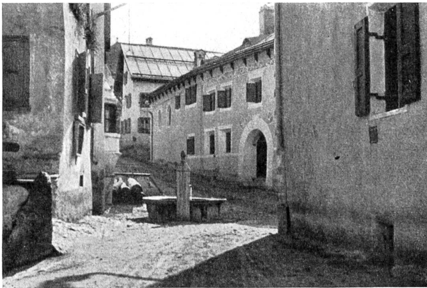
Der Brunnen auf dem kleinen Platz (bügl plazetta) in Guarda.

Auch in den Engadinerdörfern ist heute fast durchwegs die Hauswasserversorgung eingeführt. Leider sind vielfach auch die schönen alten Brunnenstöcke durch ein hässliches Gussfabrikat