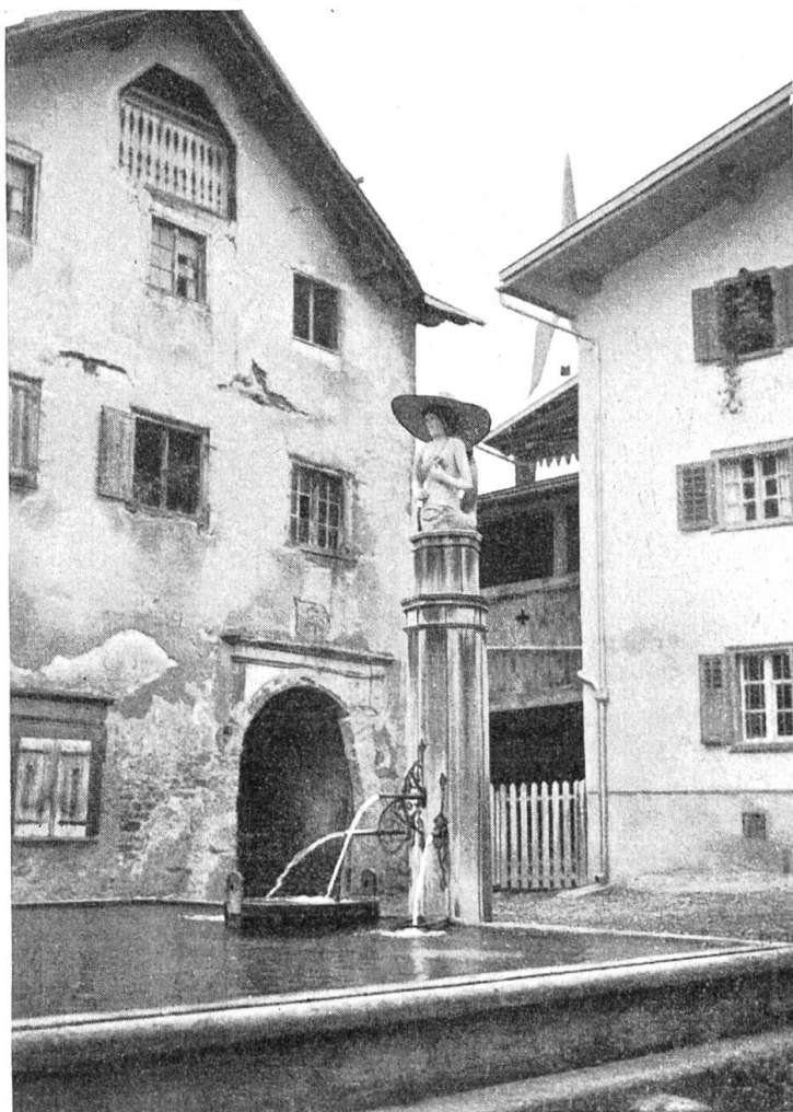
Dorfbrunnen in Valendas mit Melusinenfigur ® aus dem Jahr 1760 auf dem Brunnenstock.