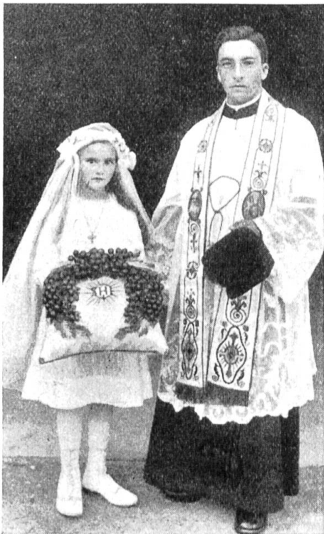
Primiziant aus dem Bündner Oberland mit Kranz.

Für jede katholische Gemeinde ist es ein Festtag, wenn ein junger Priester aus derselben zum erstenmal an den Altar tritt, seine Primiz feiert. Für die Verwandtschaft ist es ein Ehrentag und für die Mutter des Primizianten der Höhepunkt der Freude, denn für sie ist es der Tag, den sie schon lange ersehnte und den sie schon oft fürchtete nicht mehr erleben zu können. Für diesen Tag und die Zukunft wählt sich der Neupriester eine geistliche Verwandtschaft, die von nun an zu ihm steht, wie die leibliche seit der Geburt. Überall erwählt er sich einen geistlichen Vater, der ihn zum Altar führen soll, und an den meisten Orten auch eine geistliche Mutter, die mehr für sein leibliches Wohl besorgt