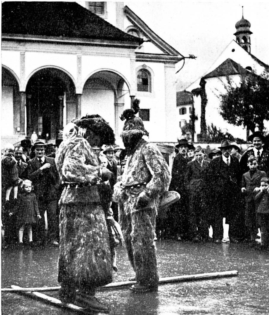
Aelplerkilbi in Stans.