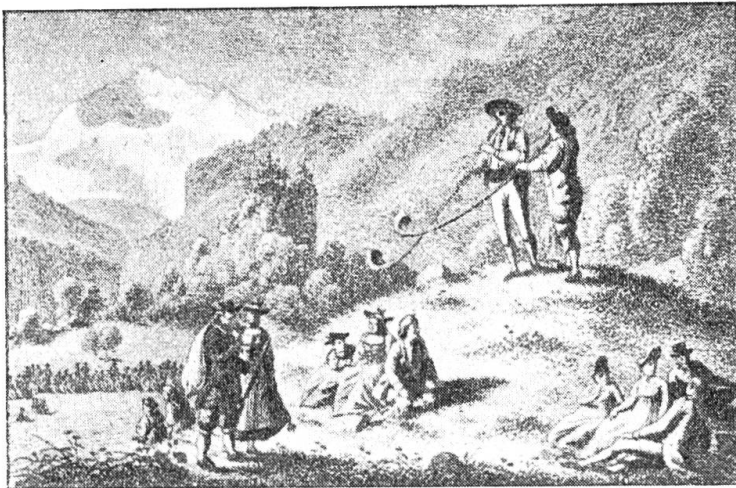
« Die Alphornblaser ».