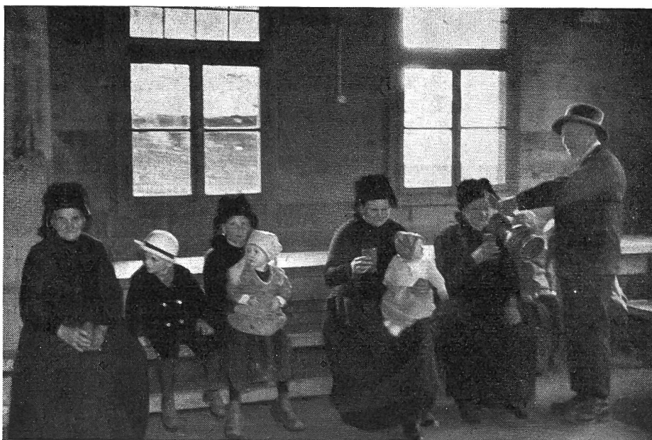
Spendausteilung an die Frauen in Ferden.

Becher Wein annehmen. Von den Spendresten gehören dem Vogt eine Kanne Wein und ein Roggenbrot; alles Übrige wird an die Ärmsten ausgeteilt. Bei den Savièsern gilt noch der Grundsatz des Bauernführers Andreas Hofer: Habens mitgegessen, sollens auch mitbeten. Nach der Spend wird in der Kapelle für die Verstorbenen der Rosenkranz gebetet.