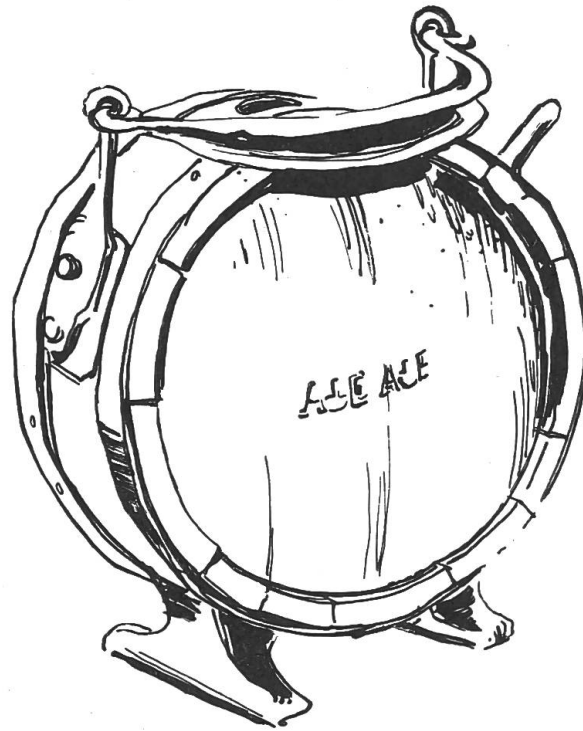
„Lögeli“ aus der Sammlung Erzer in Dornach.