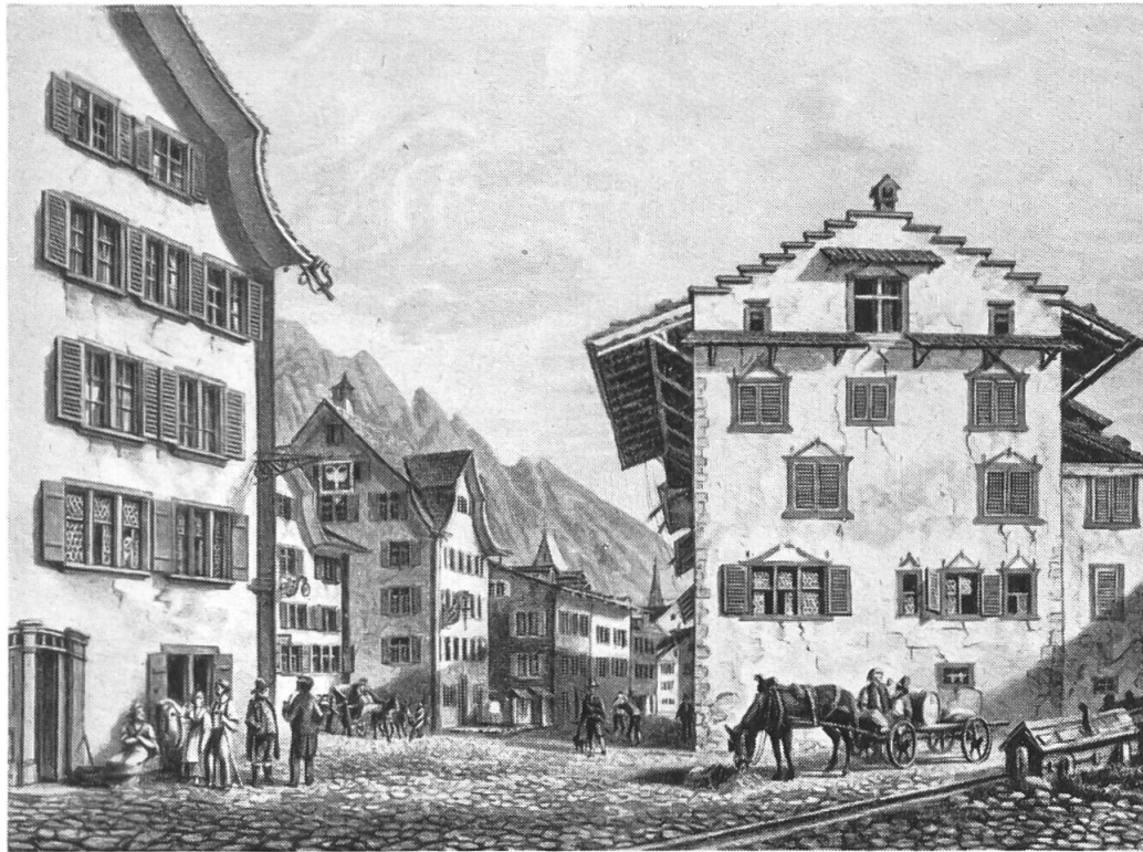
Gasthöfe im alten Glarus. Lithographie von Em. Labhardt nach J. B. Isenring um 1840 (Jenny-Kappers Nr. 171).