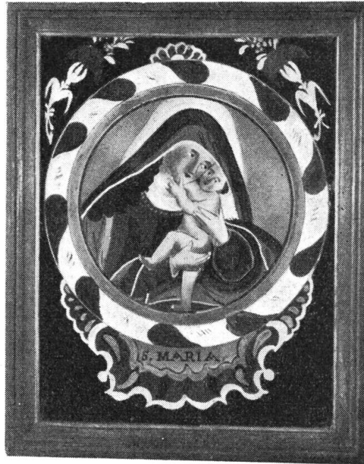
Abb. 2. – Maria mit dem Kind. Hinterglasbild aus Appenzell I. Rh. Schweiz. Museum für Volkskunde, Basel: VI 20411. 33 × 26,5 cm.