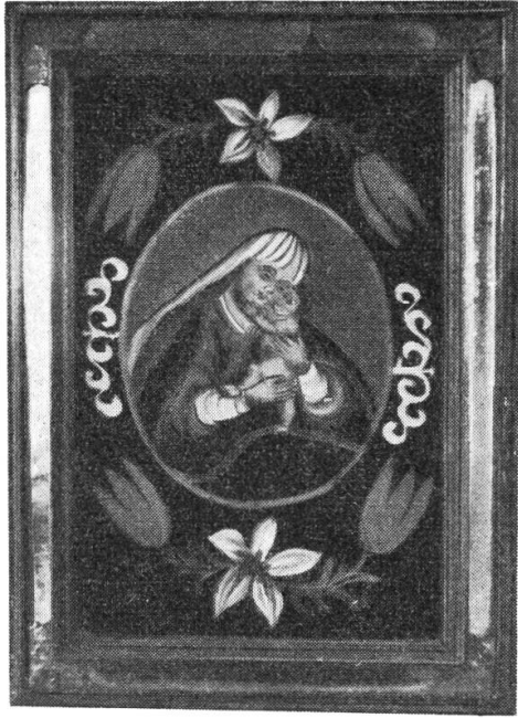
Abb. 1. – Maria mit dem Kind. Hinterglasbild. Raymundsreuter Arbeit um 1800. Aus dem Kt. Luzern. Schweiz. Museum für Volkskunde, Basel: VI 20498. 23 × 13 cm.