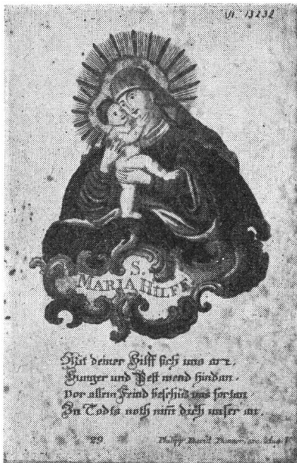
Abb. 3. – Maria mit dem Kind. Heiligenbildchen. Schweiz. Museum für Volkskunde, Basel: VI 13232. 14,5 × 9,5 cm.