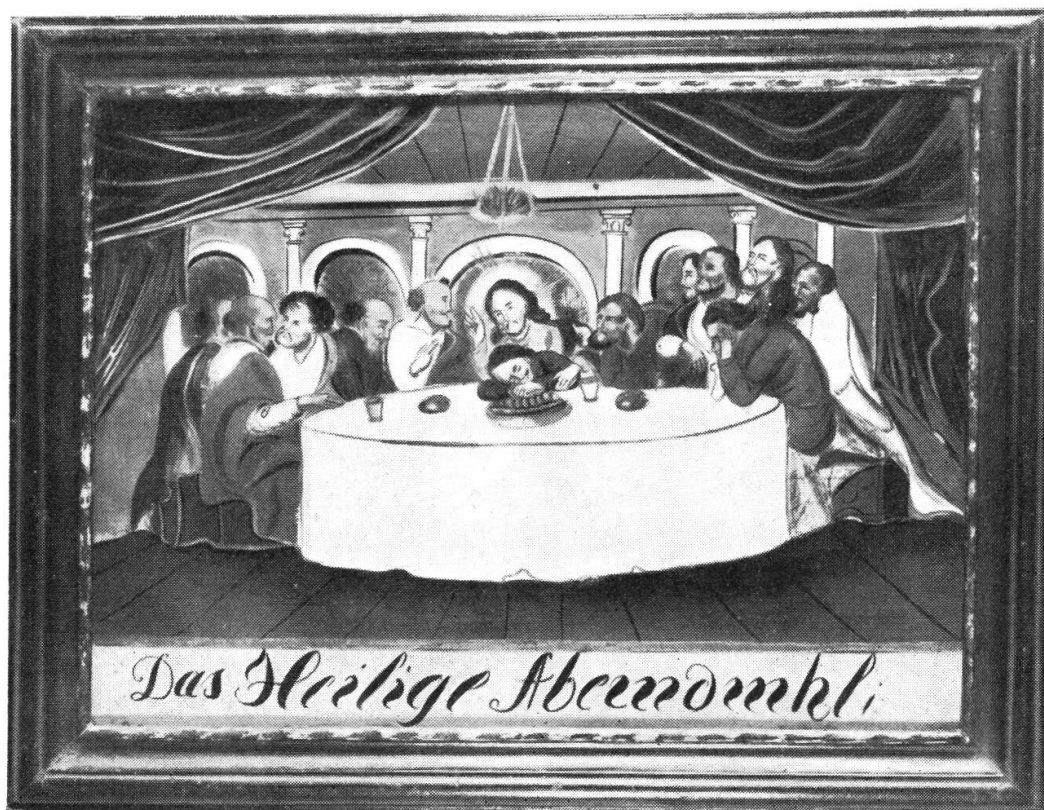
Abb. 5. – Abendmahl. Hinterglasbild aus Courrendlin im Berner Jura. Schweiz. Museum für Volkskunde. Basel: VI 53. 33,5 × 43 cm.

ganz bestimmte Vorlage eines grossen Meisters vermuten. In der Tat ist Dürers Holzschnitt B 53 eindeutig das Gesuchte (Abb. 6), denn sämtliche Hauptmerkmale stimmen überein; man muss sich nur vergegenwärtigen, dass das Hinterglasbild seitenverkehrt ist. So sehen wir auf ihm zur Linken Christi den sich so intensiv nach vorne neigenden Jünger, dann folgt eine Gruppe von fünf, unter ihnen vorne Judas, sein Haupt in die Hand stützend, über ihm drei weitere Jünger, alle deutlich nach Dürers Holzschnitt gebildet. Der äusserste, in weiss gekleidete, ist eine Zugabe des Hinterglasmalers. Zur Rechten Christi sitzen zuerst zwei Männer, die sich ihm zugewendet haben; dann folgt derjenige mit dem grossen Haarschopf, welcher sich umgewandt hat und mit den beiden zu äusserst sitzenden spricht. Von diesen legt der ganz im Profil sichtbare seine Hand flach über den Tisch, ein Detail, das also – wenn wir es mit dem Holzschnitt vergleichen – 300 Jahre nach seinem Entstehen noch immer gleich gemacht wurde. Diese Abendmahlsdarstellung im Schweizerischen Museum für Volkskunde ist die schönste und an Qualität hervorragendste von allen bisher bekannt