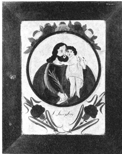
Abb. 4. – Hl. Joseph mit dem Kind. Hinterglasbild. Oberammergauer Arbeit. Aus dem Berner Jura. Schweiz. Museum für Volkskunde, Basel: VI 8483. 45 × 36,5 cm.