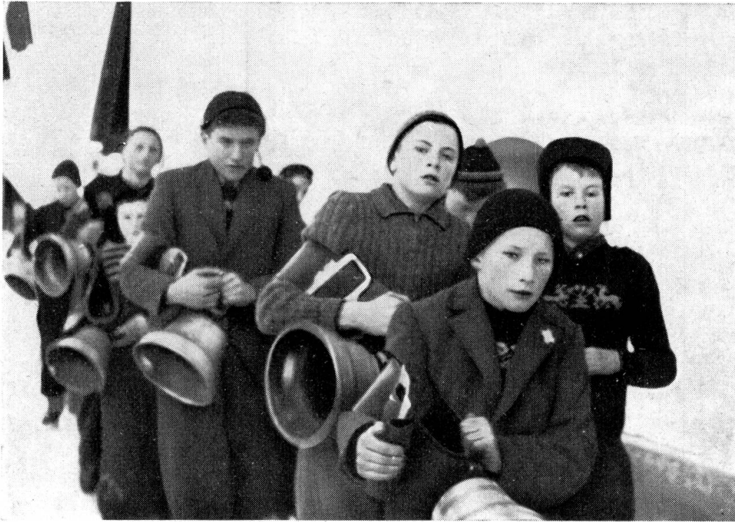
Trychelbuben in Guttannen (28. Dezember 1952)

sich ihm ein zweiter und dritter bei; ohne ein Wort zu verlieren, stellten sie sich an seine Seite und schwangen im gleichen Takte ihre Glocken. Später fand sich auch ein vorschulpflichtiger Dreikäsehoch ein. Unbeholfen schüttelte er seine Ziegenschelle. Ein Mann am Wege beobachtete eine Weile den kleinen Trychler, und dann trat er zur Gruppe, unterrichtete den Unbeholfenen im Weiterschreiten in der Handhabung seines Instrumentes und bald herrschte volle Ordnung im Trupp. Gegen Abend kam das Züglein, vermehrt um einige weitere Buben, auch am Hause meiner Gastgeber vorbei. Man verabfolgte ihnen durchs Fenster Backwerk; es war das einzige Mal, dass ich in dieser Woche die Trychelbuben im Oberhasli habe lächeln sehen.