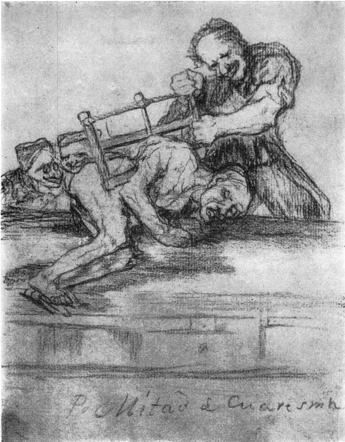
Abb. 2 – Mitad de cuaresma (nach Lafond, T. 3)