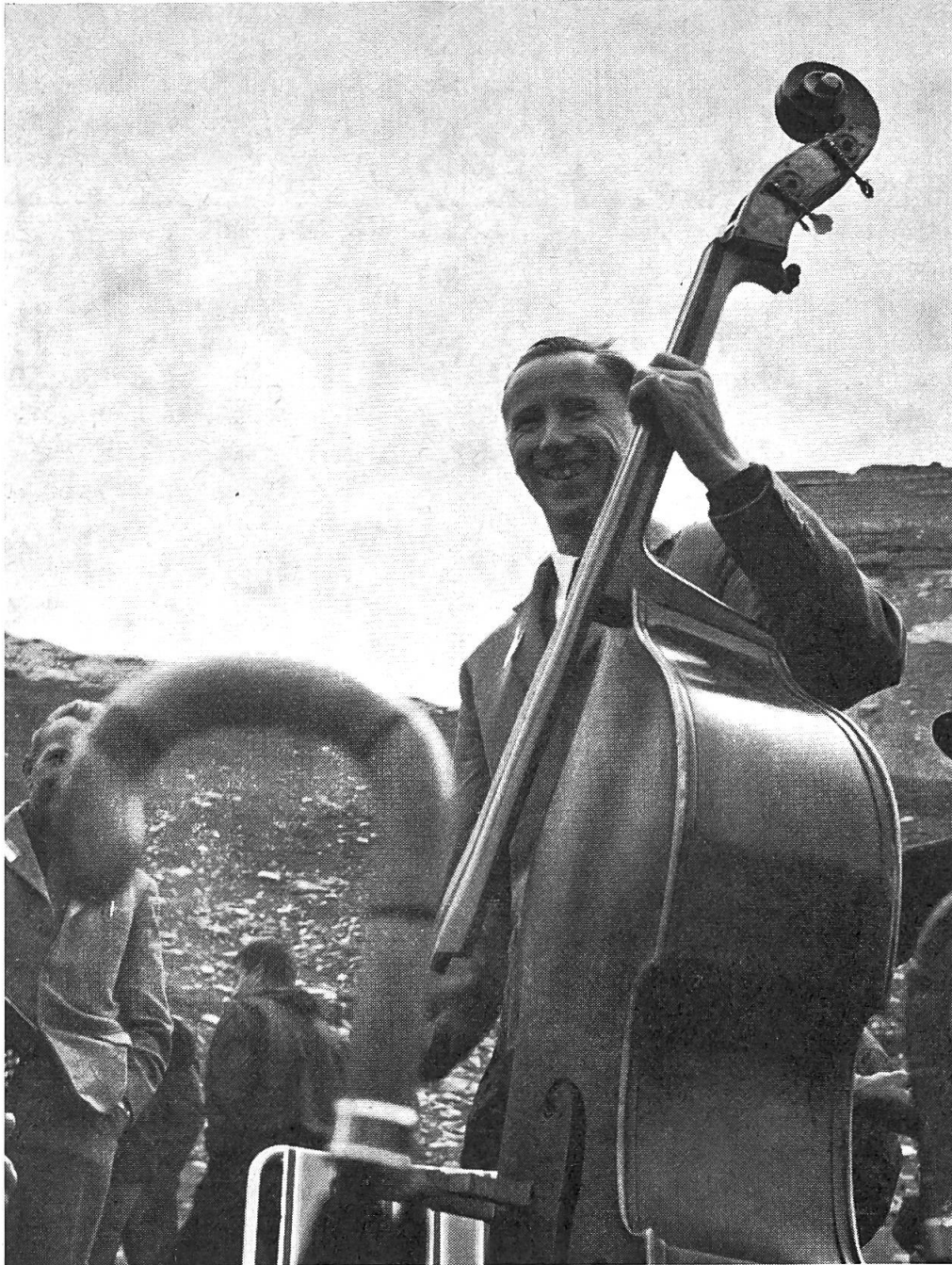
Abb. 1 Einen Schirm nimmt der Bassgeiger immer mit. Man weiss nie... denn am Daubensee gibt's kein schützendes Dach.