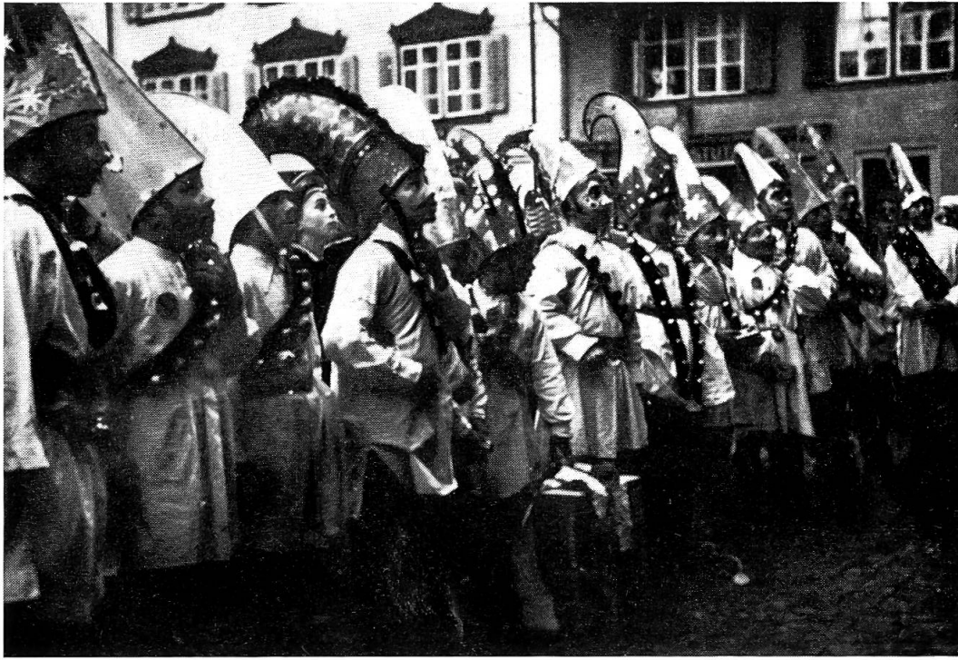
Preisverteilung nach dem Wettbewerb von 1943

mehrere Geiggel , je nach Größe der Klasse. So ist es denn eine große Ehre, gewählt zu werden. Der kleine Geiggel setzt alles daran, möglichst viel Geld in seine Kasse zu bekommen, denn dieses wird nachher vom Lehrer unter die Kinder der ganzen Klasse gleichmäßig verteilt. Im Unterschied zu den Geiggeln des großen Umzugs gehen die Kinder-Geiggel oft völlig unabhängig von den Treichlergruppen in alle Häuser, und dies etwa nicht immer zu Fuß, auch das Velo wird benutzt oder ein Wägelchen mit vorgespanntem Pony. In der gegenwärtigen Rollschuheuphorie wird der Geiggel auf Rollern wohl nicht mehr lange auf sich warten lassen.