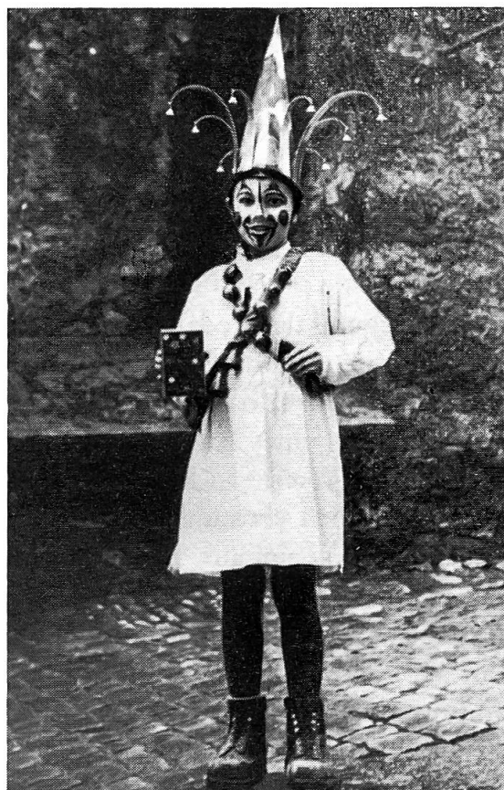
«Kinder-Geiggel» in den vierziger Jahren