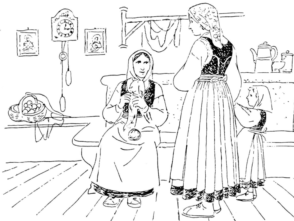
Die alte Frauentracht. Aus: Tobias Tomamichel, Bosco Gurin. Das Walserdorf im Tessin, Basel 1953 (Reihe «Tradition und Wandel» der SGV, Band 9).

Aber fast nur Angeheiratete und ihre Töchter trugen sie an Festtagen im Sommer. Weil die meisten eigenen Bestände als «ausgedientes Gewand» zu Finkensohlen ( Tschaatusola ) verarbeitet worden waren, mußte man die Trachten entleihen, wenn man welche für ein Trachtenfest oder