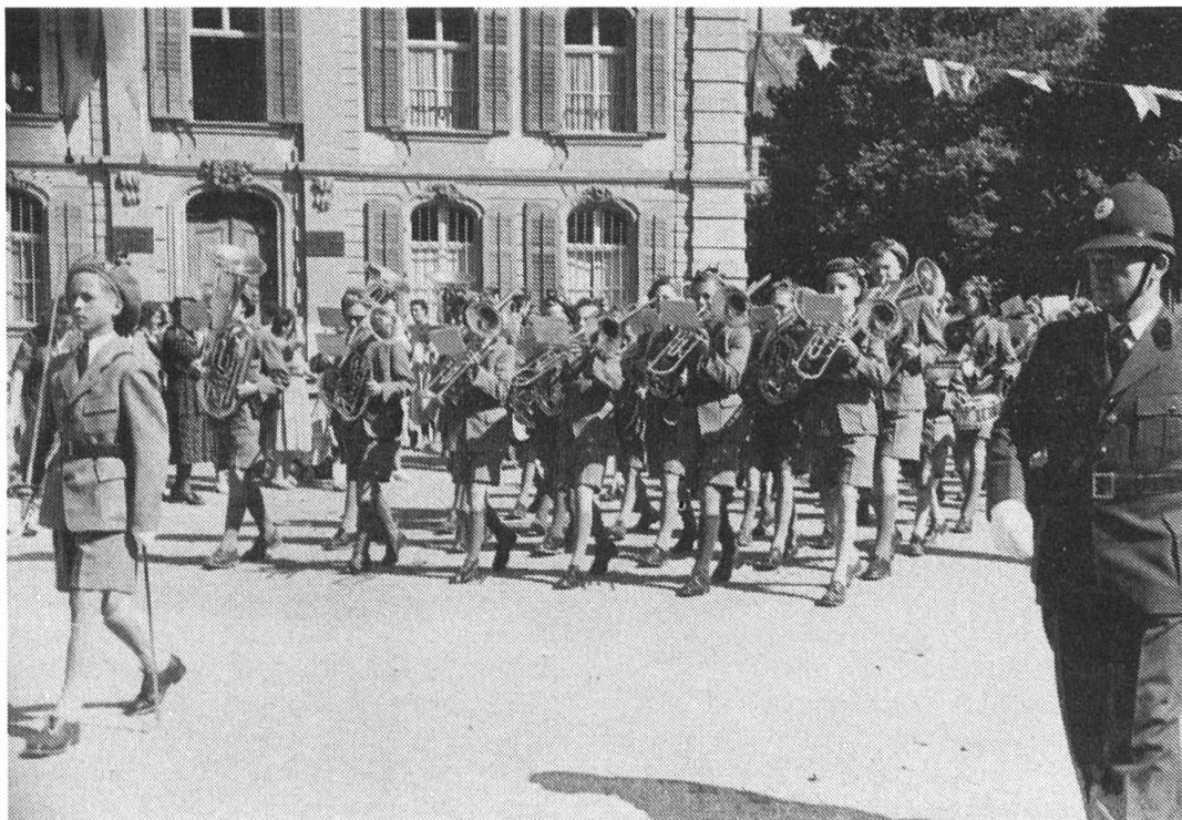
Die Kadettenmusik Zofingen um 1950.