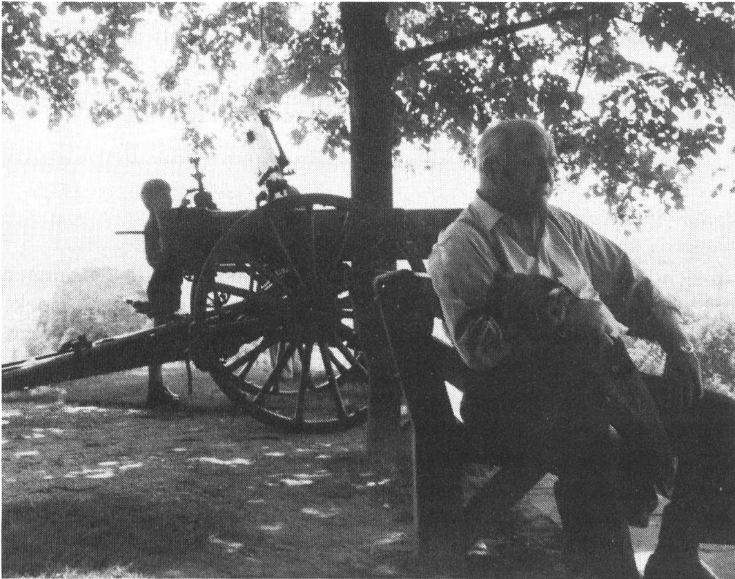
Impressionen vom Zofinger Kinderfest.