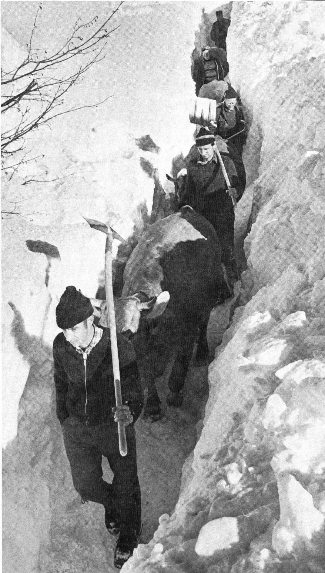
Die Länge der Schneeschlucht betrug im Winter 1981/82 sieben Kilometer.