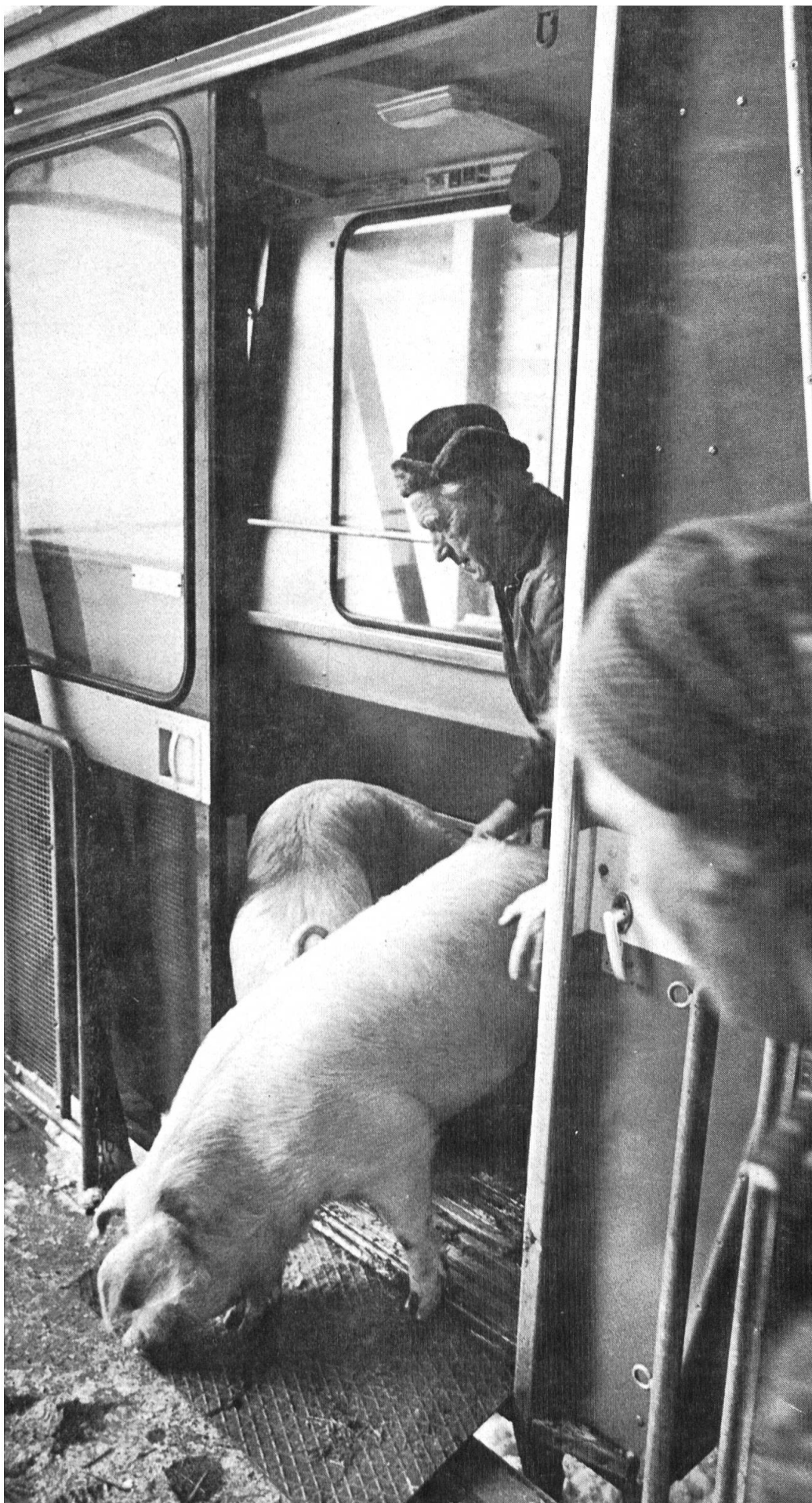
Kälber und Kleinvieh werden nach Möglichkeit mit einer Seilbahn ins Tal befördert