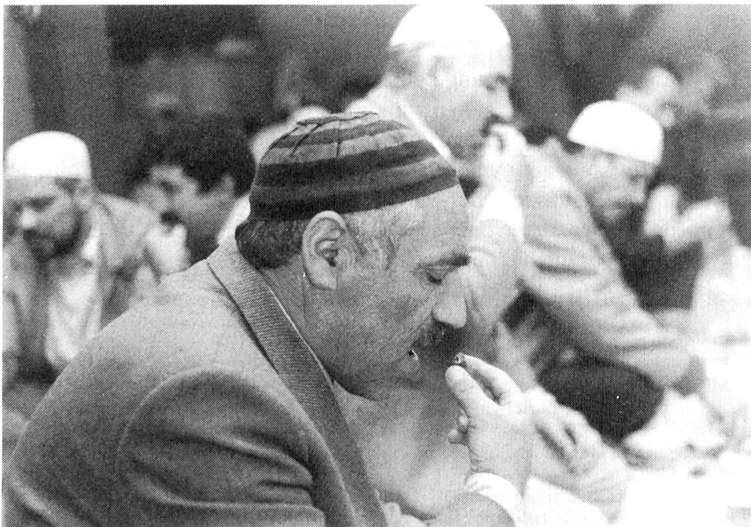
Der Moment des rituellen Fastenbrechens nach Sonnenuntergang im Ramadan.

Der zweite Verein ist die «Moschee Kommission Basel» und betreibt seit 1982 in der alten Kaserne in einem Dachraum eine Mescid. Er ist Mitgliedsorganisation der «Isvicre Islam Cemiyetleri Federasyonu» mit Hauptsitz in Zürich. In Basel zählt er 80 Mitglieder, die zu einem grossen Teil den Ausbau des Estrichs zum Gebetsraum möglich gemacht haben. Beiden Mescid gemeinsam ist, dass sie von Vereinen getragen werden, deren Mitglieder fast ausschliesslich Türken sind. Beide Vereine verstehen sich nur als Dienstleistungsbetriebe, die für die Aufgaben der Gebetsräume verantwortlich sind. Sowohl in der Kaserne als auch an der Nauenstrasse wird betont, dass jeder Muslim Mitglied ist. Einen ungefähren Eindruck vermittelt die Teilnahme am Freitagsgebet, das für Männer obligatorisch