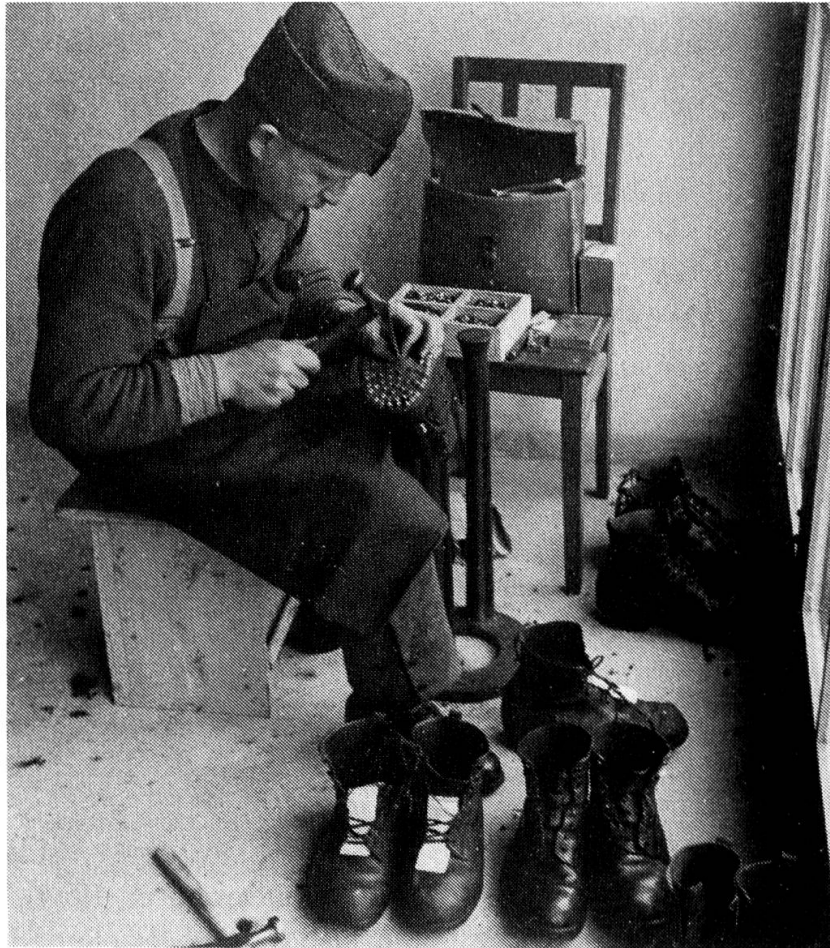
Militär- schuhmacher 1939–1945