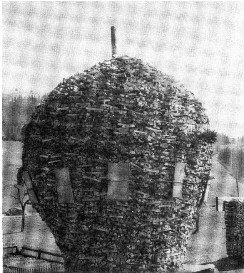
Kröschen- brunnen/Emmen- tal BE