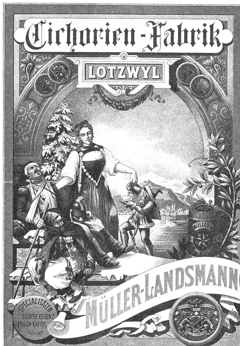
Abb. 2 Cichorien-Fabrik Lotzwyl. Chromolithographie von Karl Jauslin.

ken. Nach des Dichters Meinung erfrische der Kaffee nicht nur den Leib, sondern gebe auch dem Geiste einen Halt. Er sei zwar beinahe eine Droge, aber auf eine auffrischende, nicht kraft- und lebenaufzehrende Art 19 . Der Kaffee findet auf dem Speisezettel des Emmentaler Bauern einen wichtigen Platz. Gedörrte Möhren und Rüebli werden als Ersatzkaffee bei ärmeren Bauern verwendet. Ein guter Bohnenkaffee hingegen ist das Privileg der Meistersleute. Eine junge Meistersfrau, die aber zu oft Kaffee braut und sich dazu noch die Leckerei eines Eiertäsch (Omelette) leistet, wird als faul und nicht vorbildhaft betrachtet. Als besondere Sorge für die Dienstleute wird ihnen erlaubt, bei Abwesenheit der Meistersleute Kaffee zu machen und zu kücheln (= backen) 20 . Kaffee als Tröster und Zungenlöser wird von der Bäuerin dann einge-