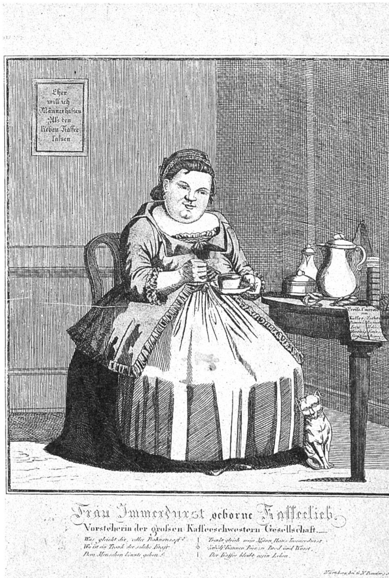
Abb. 3 «Frau Immerdurst, geborne Kaffeelieb». Holzstich. Nürnberg 1850, Johann Jacobs-Museum, Zürich

Abrundung nach jeder Gemeindeversammlung). Obwohl der Kaffee ursprünglich im 17. Jahrhundert ein Männergetränk war, das ausschliesslich im Kaffeehaus genossen wurde, so gab es im 19. Jahrhundert die sogenannten Kaffeeschwestern, deren Wahlspruch lautete: «Lieber will ich Männer hassen als den lieben Kaffee lassen» (Abb. 3). Auch bei Gotthelf findet man Anspielungen auf die «Kaffeesucht» der Frauen: «Es gibt zwei Mittel im weiblichen Leben, welche die Weiber munter und frisch erhalten, die sind Kaffee und Klagen. Hat ein Weib Kaffee, kann es klagen, beides nach Herzenslust, dann ist es glücklich, schwimmt obenauf, hat es nur das eine oder das andere, so gehts wohl, aber kümmerlich und gedrückt; fehlen beide, ja, dann fehlt's wirklich, dann ist es Zeit zu sagen: 'O ihr Hügel, stürzt über mir zusammen und ihr Berge, decket mich!'» 25