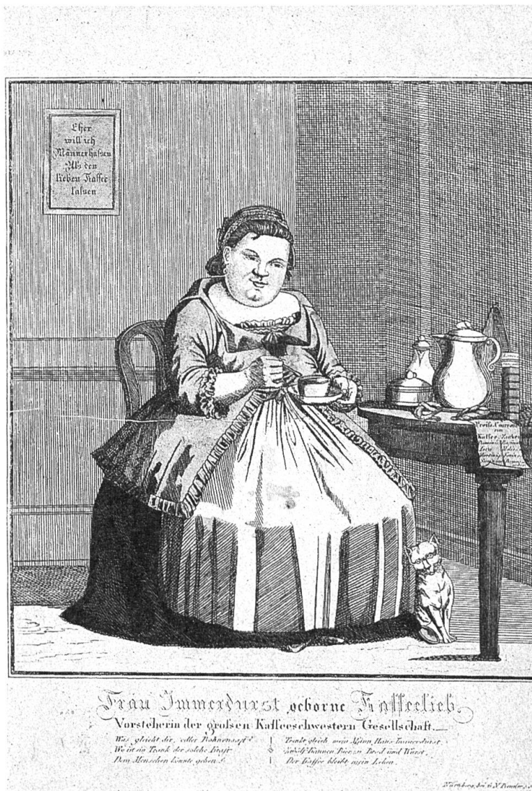
Abb. 3 «Frau Immerdurst, geborne Kaffeelieb». Holzstich. Nürnberg 1850, Johann Jacobs-Museum, Zürich

Abrundung nach jeder Gemeindeversammlung). Obwohl der Kaffee ursprünglich im 17. Jahrhundert ein Männergetränk war, das ausschliesslich im Kaffeehaus genossen wurde, so gab es im 19. Jahrhundert die sogenannten Kaffeeschwestern, deren Wahlspruch lautete: «Lieber will ich Männer hassen als den lieben Kaffee lassen» (Abb. 3). Auch bei Gotthelf findet man Anspielungen auf die «Kaffeesucht» der Frauen: «Es gibt zwei Mittel im weiblichen Leben, welche die Weiber munter und frisch erhalten, die sind Kaffee und Klagen. Hat ein Weib Kaffee, kann es klagen, beides nach Herzenslust, dann ist es glücklich, schwimmt obenauf, hat es nur das eine oder das andere, so gehts wohl, aber kümmerlich und gedrückt; fehlen beide, ja, dann fehlt's wirklich, dann ist es Zeit zu sagen: 'O ihr Hügel, stürzt über mir zusammen und ihr Berge, decket mich!'» 25