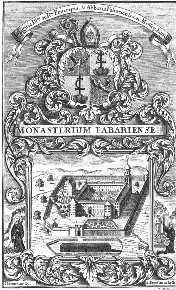
Abb. 1 Die Abtei Pfäfers mit Kloster- wappen. Stich aus der «Idea Sacrae Congregationis Helveto-Benedictinae» 1702.

hatten den Stand von Leibeigenen, von Leuten, die voll in der Verfügungsgewalt der Abtei standen. Ein Verhältnis also, das eine besondere persönliche Beziehung zum Kloster mit sich brachte, die sich gewiss nicht nur in Abgaben wie derjenigen des Fasnachtshuhns und des Besthauptes äusserte. Volkskundlich interessant ist beispielsweise der Brauch, dass die Kerzner des Klosters, eine besonders eng an den Abt gebundene Schicht der Klosteruntertanen, noch im 18. Jahrhundert jeweils an Mariä Lichtmess vom Abt empfangen, begrüsst und bewirtet wurden. Es ist festzuhalten, dass lange nicht alle Bewohner der Gegend Leibeigene der Abtei waren; es gab in allen Dörfern des klösterlichen Territoriums auch Leibeigene der Grafen und anderer Leibherren. Gewiss war die Abtei Pfäfers nicht nur in ihrem Territorium von Einfluss, sondern sie übernahm die Seelsorge auch in den meisten übrigen Pfarreien im Sarganserland und teilweise darüber hinaus. Gerade im Barock, als die Pfarrstellen häufig durch Ordensleute besetzt wurden, ist der prägende geistig-geistliche Einfluss der Pfäferser Konventualen auch auf die Untertanen besonders greifbar und klar. Dies zeigte sich teilweise auch in einer gewissen liberalen Ausrichtung von einzelnen Gläubigen in verschiedenen Pfarreien.