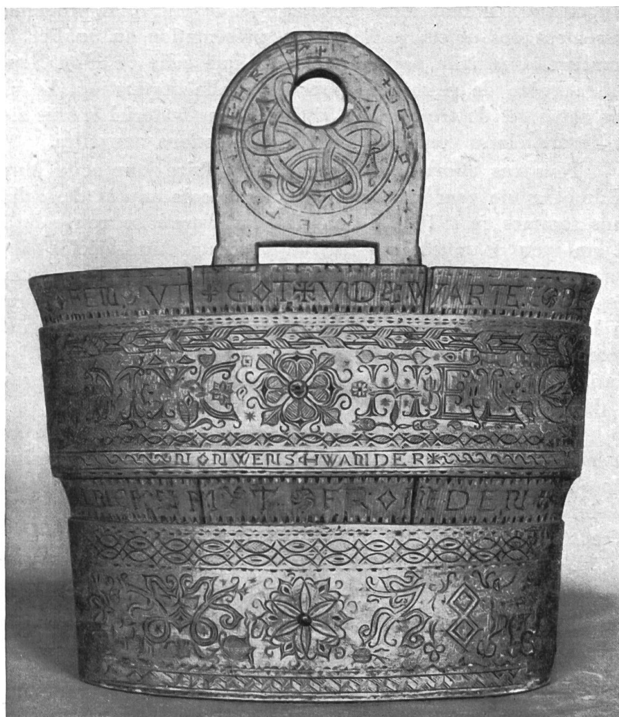
Fig. 1. Seille à traire, en bois sculpté et peint, portant la date de 1678, Berne.