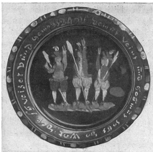
Fig. 5. Ancien plat de faïence, de Heimberg (Berne).

jets traditionnels tendent à disparaître. D'autre part, le Museum für Völkerkunde de Bâle possède, en ce qui concerne le folklore helvétique, de telles richesses qu'il paraît vain de vouloir rivaliser avec lui. Le Musée d'Ethnographie de Genève possède néanmoins quelques belles pièces dans ce domaine: une vitrine montre de nombreux systèmes d'éclairage, lampes en pierre de différentes formes, bougeoirs en fer forgé ou en laiton, lanternes diverses et un objet en bois