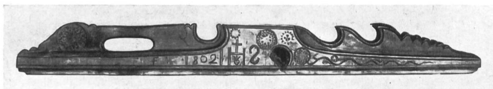
Fig. 4. Varlope en bois sculpté, portant la date de 1802. 102 cm de longueur. Valais (?).

La difficulté d'obtenir des objets provenant d'Amérique, d'Océanie, d'Afrique ou d'Asie, détermina le Directeur à porter tous ses efforts dans cette direction, au détriment momentané de l'Europe et plus particulièrement de la Suisse. Le fait d'être sur place permet d'envisager facilement l'enrichissement de ces deux collections. Evidemment, il faut se hâter, car de plus en plus on est gagné par les nouveautés qu'offre l'heure actuelle et les ob-