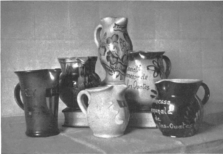
Fig. 2. Quelques «taruts» de vogue.

autres. Or, autrefois, c'était à la Jeunesse qu'il appartenait essentiellement de distraire les gens de la commune en organisant pour eux des bals, des représentations théâtrales ou musicales.