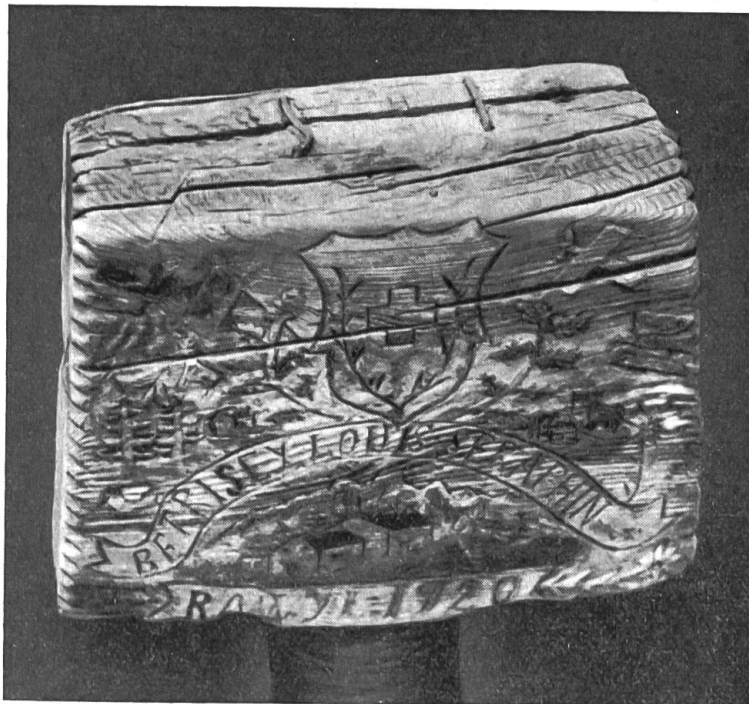
Pō de mulet à l'alpage de Rawyl, face antérieure.

L'alpage du Rawyl occupe toute la partie supérieure du vallon de la Liène. Le chalet principal comprend une cuisine, une grande pièce servant de dortoir et la cave aux fromages;