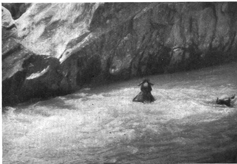
Fig. 2. Le mouton est entraîné quelques mètres par le courant, puis il se met à nager dans la direction de la rive opposée à celle d'où il fut immergé.

Lötschental, des rites cultuels anciens encore vivants aujourd'hui. Le rite de la baignade pourrait fort bien en être un dont on a oublié la signification.