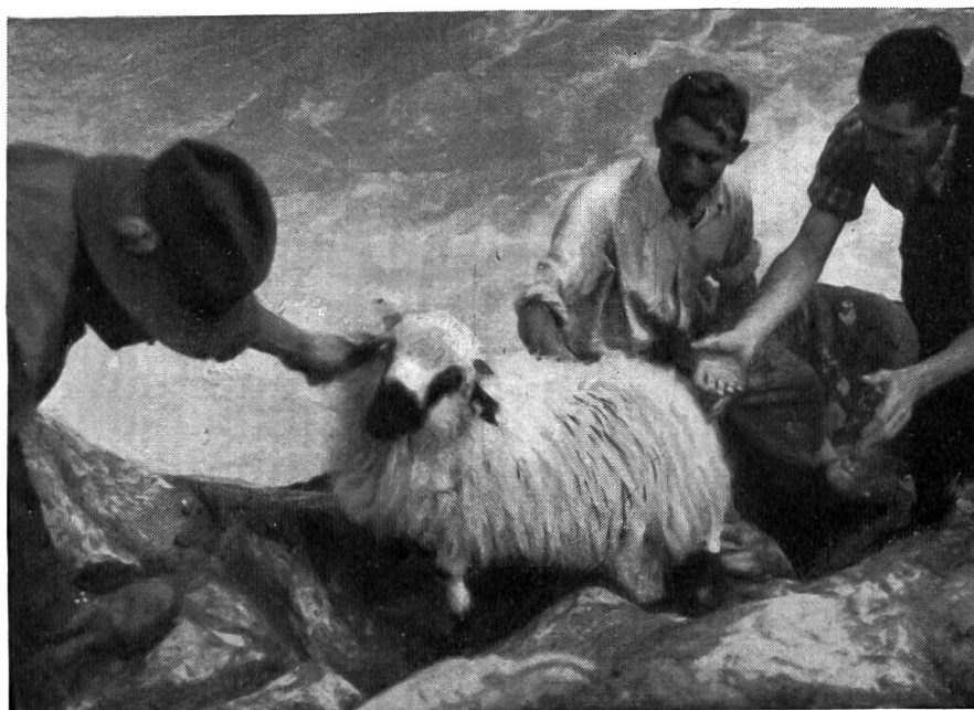
Au bas du couloir rocheux deux hommes reçoivent le mouton qui est poussé par un berger.