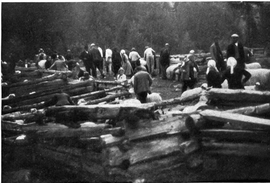
Fig. 1. Les parcs de Fafleralp où les propriétaires viennent trier leurs moutons.

Environ 1200 moutons étaient, cette année-là, rassemblés. Ils appartenaient à tous les villages et hameaux du Lötschental, depuis Gampel.