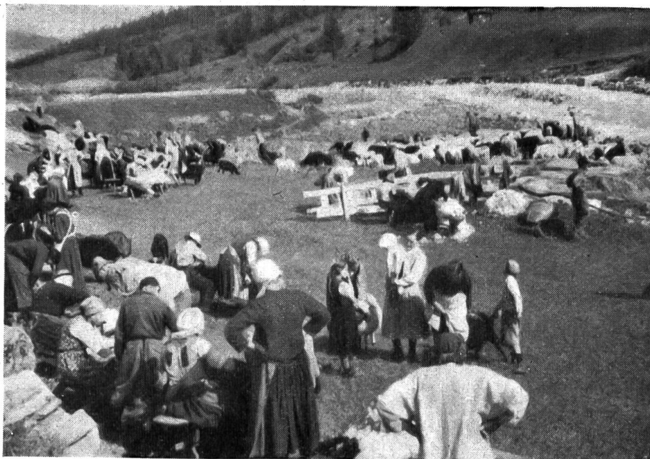
Fig. 6. La tonte des moutons à Blatten.

sont rétives, elles cabriolent. L'inspecteur examine, prend des notes. Au début de l'après-midi, il désignera le plus beau mouton. Les concours font partie du programme fédéral des associations paysannes pour l'amélioration du cheptel ovin.