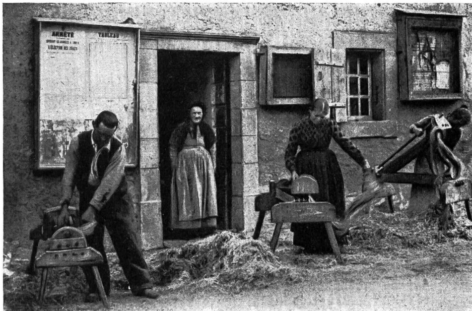
Fig. 4. «Scène vaudoise — Battage du chanvre».

D'après une ancienne carte postale signée: Photographie des Arts, Lausanne.