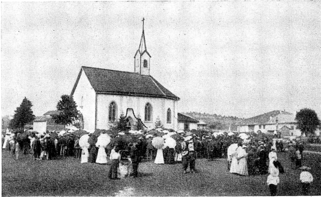
25 e anniversaire de l'érection de la chapelle du Peuchapatte en 1908