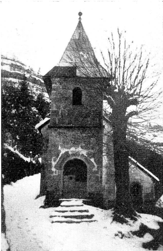
Chapelle du Bief d'Estoz