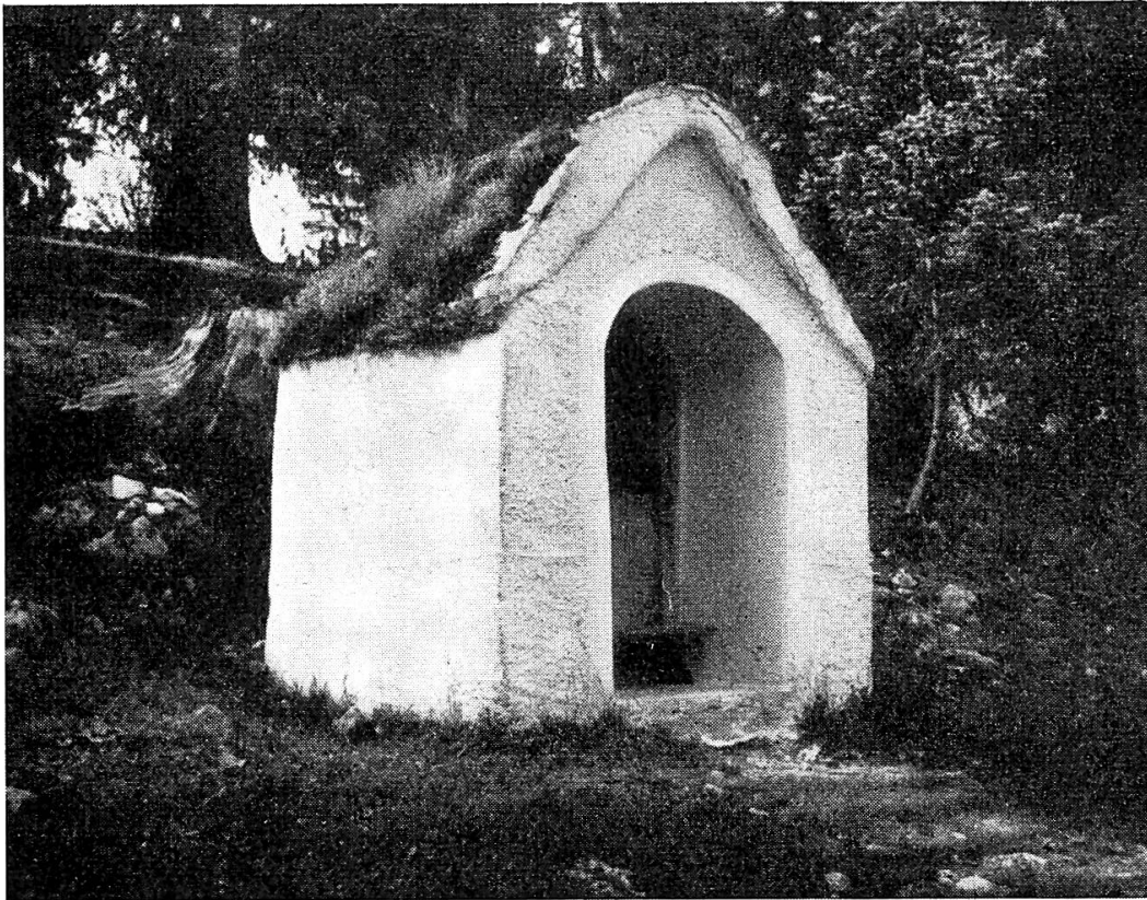
Oratoire des Quedevez

vantant de ne croire ni à Dieu ni à diable qui connut de la sorte que sa dernière heure sonnerait dans six années. De nouveaux essais indiquèrent quatre mois puis douze jours. Il mourut bel et bien six ans, quatre mois et douze jours plus tard. Sa veuve, qui connaissait seule son secret, affirma qu'il fut en très bonne santé durant les cinq premières années. La sixième, il tomba malade. Le premier mois de l'année suivante, il dut s'aliter. Son état s'aggrava de plus en plus. Il mourut au dernier coup de minuit du douzième jour du cinquième mois.